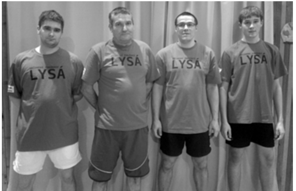
Stolní tenisti Lysej pod Makytou nedokázali dotiahnuť do konca záchrannú prácu. V 19. kole prehrali doma so Slovanom Považská Bystrica a definitívne tak zostupujú do šiestej ligy.