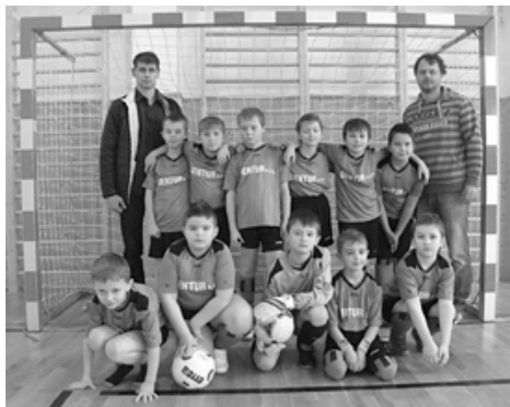
Belušské talenty vyhrali v Bolešovej jeden zápas a obsadili štvrté miesto.