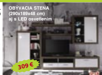
OBÝVACIA STENA (290x189x48 cm) aj s LED osvetlením

poloh.lamelový rošt luxusný matrac do 110 kg prehoz český výrobca