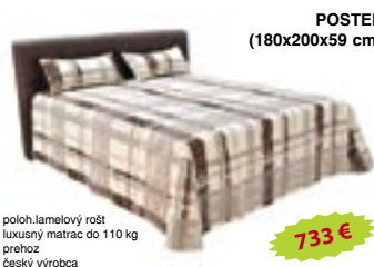
POSTEL (180x200x59 cm)