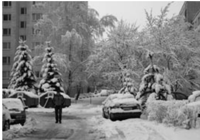
Po skúsenostiach s vľajšou Veľkou nocou zostávajú cestári napriek teplému počasiu v pohotovosti. Viani v posledný marcový deň napadlo 20 centimetrov snehu.

Cesty, ktoré patria pod správu Trenčianskeho samosprávneho kraja, sa samozrejme nachádzajú aj na území Púchovského okresu.