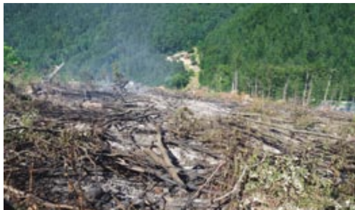
Júlový požiar v Papradne zaznamenal štyri tohtoročné NAJ. Jedným z nich je aj 660 metrov dlhé hadicové vedenie na dopravu vody na požiarisko.

Na území okresu Púchov vzniklo v roku 2013 o 23 požiarov menej ako v roku 2012, čo predstavuje pokles o 27,71 %, pričom paradoxne priame škody sú vyššie o 128 490 € a uchránené hodnoty