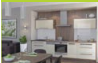
KUCHYNSKÉ LINKY NA MIERU

Hollého 1925/18, 020 01 PÚCHOV 0948 955 191 ☎ 042/438 4317