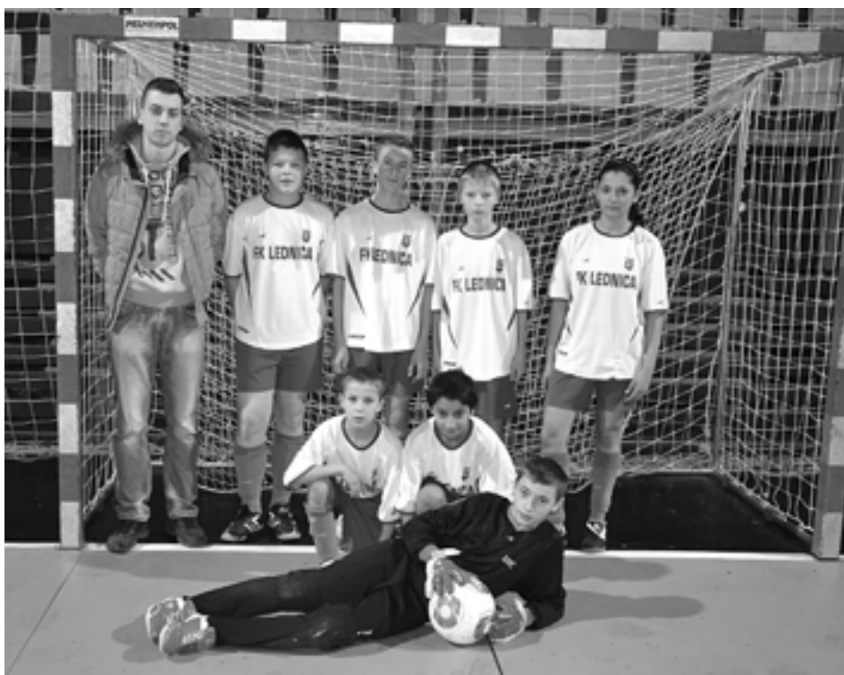
Starší žiaci Lednice siahali na turnaji v Púchove na medailové umiestnenie. Napokon im o vlások uniklo.

Skupina B: FK Lednica - Výber ObFZ Pov. Bystrica 2:0 , Rác, Zbranek, Prečín – Streženice 1:0 , P. Blaško, FK Lednica – Ladce 1:1 , Zbranek – Kandráč, Výber ObFZ Pov. Bystrica – Streženice 0:2 , Hofierka, Proč, Prečín - FK Lednica 0:1 , Rác, Ladce - Výber ObFZ Pov. Bystrica 4:2 , Kútňny, Adamec, Bratina, Kandráč – S. Bartoš 2, Streženice - FK Lednica 0:0 , Ladce – Prečín 2:0 , Adamec, Kandráč, Výber ObFZ Pov. Bystrica – Prečín 1:2 , Rebro – Bí-