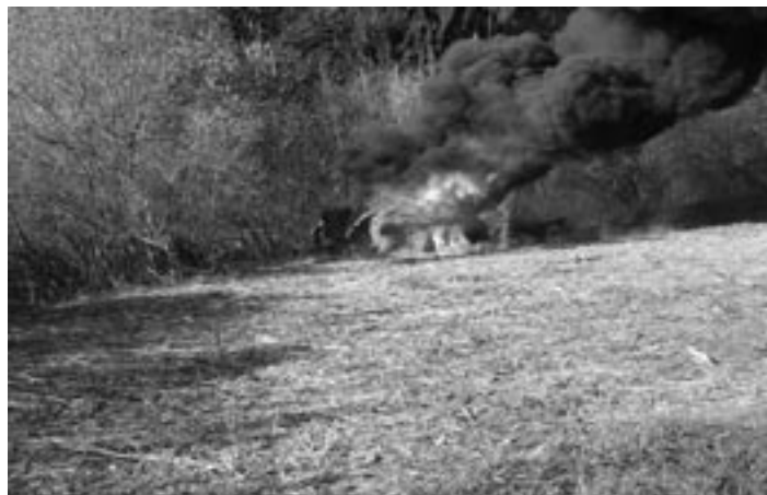
Medzi požiarmi s najvyššou vzniknutou škodou dominuje požiar lesného traktora v obci Visolaje dňa 25. októbra 2013, pri ktorom vznikla škoda 130 000 €.

počtu usmrtených a zranených osôb. Rok 2013 sa stal osudným pre 10 osôb, k zraneniu prišlo 114 osôb a našťastie až 129 osôb bolo pri zásahovej činnosti zachránených.