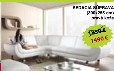
SEDACIA SÚPRAVA (300x255 cm) pravá koža