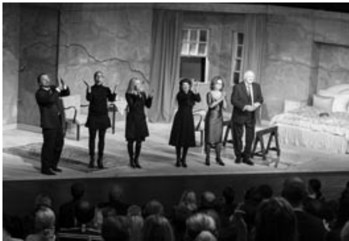
Divadelné dosky nového divadla pokrtili herci SND hrou Pamäť vody.

ďalších mesiacov uvedený aj termín spustenia predpredaja vstupeniek. Naviac, na marec pripravujeme aj komplexnejší prehľad dominantných podujatí a ich termínov až do konca roka. Pri každom bude uvedené, odkedy sa spúšťa predpredaj. Potom sa už len treba postaviť do radu a kúpiť si vstupenku. Uvažovali sme aj o online predaji, ale ten by otvoril priestor ešte viac a mohlo by sa stať, že sa Púchovčanom, pre ktorých sa prioritne stavalo divadlo, ujde ešte menej lístkov, keďže by si vstupenky jedným rýchlym kliknutím mohli kúpiť aj návštevníci širokého okolia, okolitých miest. Zatiaľ teda zostávame pri klasickom predpredaji vstupeniek a informačnom toku na web stránkach DK, mesta, facebooku, za priestor sme vďační aj Púchovským novinám a televízii, ale nájdete „nás“ plagátovo či bulletinovo aj vo vybraných prevádzkach kaviarní, reštaurácii ap. No a každého, kto nám pošle svoju mailovú adresu, zaraďujeme aj do databázy tých, komu sa s programom radi natlačíme aj do firemnej či privátnej emailovej schránky... ☺