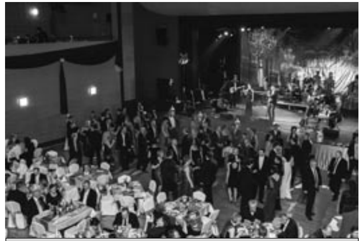
Vďaka otvoreniu nového divadla sa po piatich rokoch obnovila aj tradícia mestského bálu.

- Aktuálne riešime nový vizuál aj obsahovú zložku našich mesačných plagátov a programových letákov. Od februára bude pri každom z plánovaných podujatí