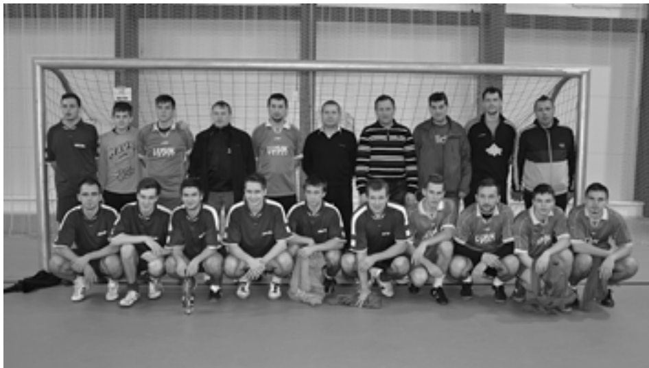
Spoločná fotografia Dolných Kočkoviec A a rezervy. Kým o víťazstve áčka rozhodlo víťazstvo vo vzájomnom stretnutí s Hornou Porubou, rezerva nedosiahla na bronzový stupienok.