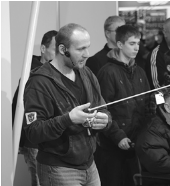
K ukážkam prívlače na gumové nástrahy pridal majster sveta aj odborný výklad a praktické rady rybárom.