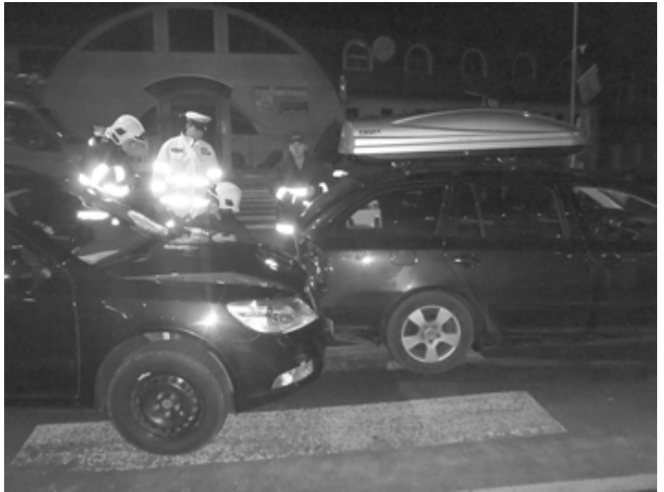
Minulý týždeň bol na cestách Púchovského okresu relatívne pokojný. Nehody si nevyžiadali žiadnu obeť.

Pomaly už tradičnú sťažnosť na hluk zo zábavného podniku na Royovej ulici v Púchove riešili mestskí policajti krátko pred pol jedenástou v noci. Oznamovateľka uviedla, že z prevádzky vychádza hluk a ona nemôže spať. Hliadka na mieste žiadne porušenie VZN o rušení nočného pokoja nezistila, majiteľ prevádzky skonštatoval, že žena sa sťažuje na hluk aj na pravé popoludnie. Asi o pol hodinu sa sťažovala opäť, hliadka rušenie nočného pokoja opäť nezistila.