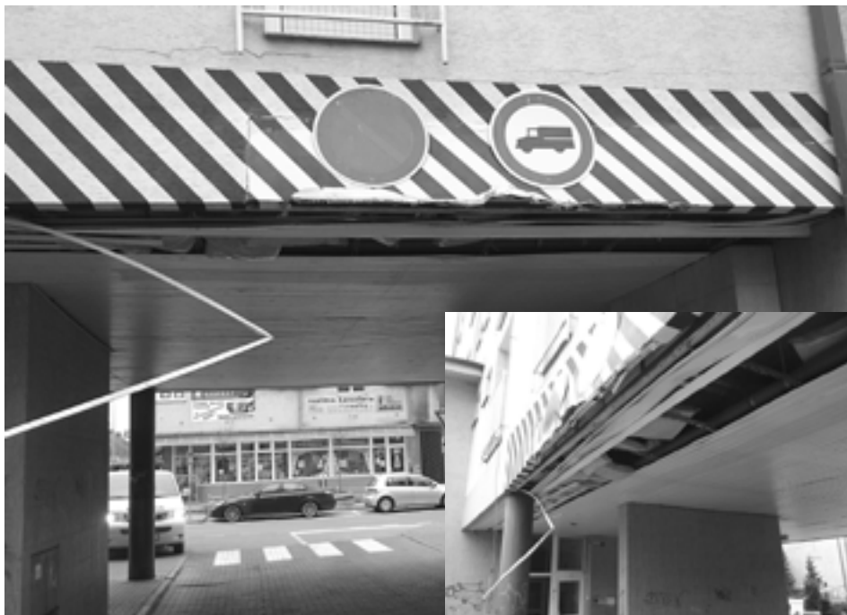
Niektorým vodičom zrejme dopravné značky a výstraha v podobe čierno-žltých pruhov nestačia...

Hliadka MsP riešila znečistenie vozovky v časti Vieska-Bezdedov. Nákladným autom znečistenú cestu fotograficky zdokumentovali, priestupok je v riešení.