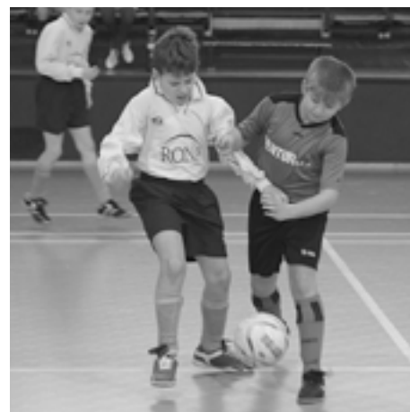
Bojovalo sa o každú piad' hracej plochy...