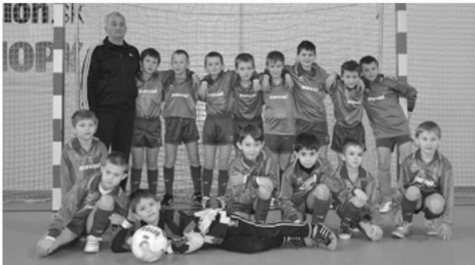
Prvenstvo z halového turnaja prípraviek si z Púchova odviezli chlapi Domaníže.