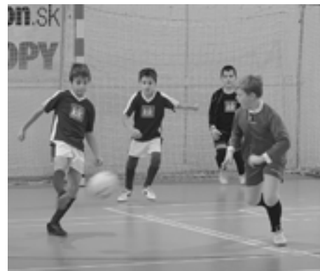
Prípravkári Hradčanu Lednica (v bielych trenkách) síce do boja o prvenstvo nezasiahli, zanechali však dobrý dojem.