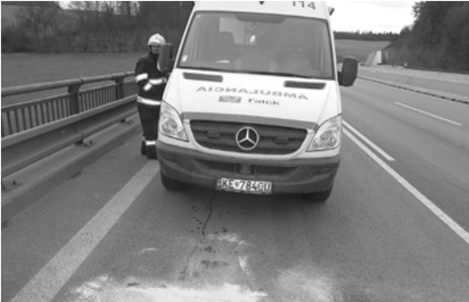
Únik prevádzkových kvapalín zo sanitky likvidovali minulý týždeň na diaľnici D1 Púchovskí hasiči. Kvapalina vytekala z vozidla, ktoré zachraňuje životy...