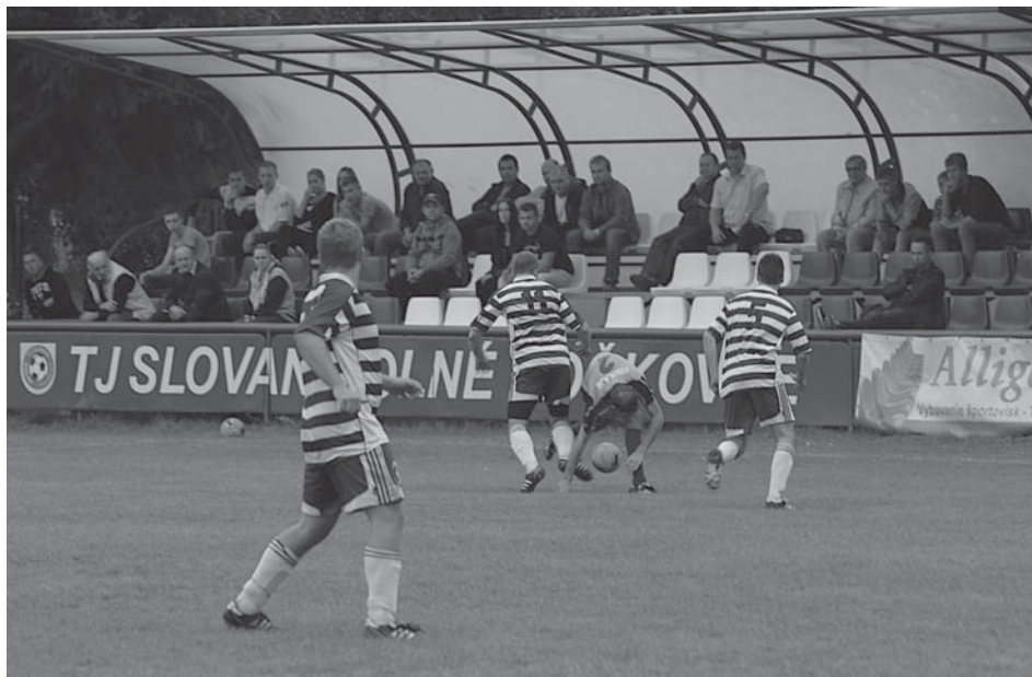
Zvýšenie komfortu divákov prinieslo v Dolných Kočkovciach pred pár rokmi vybudovanie krytých tribún, diváci by však privítali aj väčšiu gólovú a bodovú žatvu zo strany futbalistov.

Dolné Kočkovce pritom vstúpili do súťaže veľmi dobre. Po domácej remíze v okresnom derby s Lysou pod Makytou uštedrili v druhom kole Dolnokočkovania výprask Malým Ledniciam na ich trávniku (5:1), v treťom kole porazili doma v ďalšom okresnom derby Visolaje 2:0 a v ďalšom kole priviezli bod za remízu z trávniku nevyspytateľného Dulova, ktorý doma príliš nestráca. Po štyroch kolách tak mali Dolné Kočkovce na svojom konte luxusných osem bodov a zdalo sa, že si budú v pohode vegetiť v hornej polovici tabuľky. Opak bol však pravdou. Dolnokočkovský Armagedon odštartoval