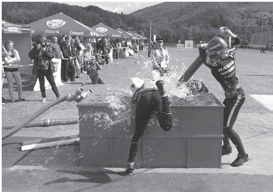
Za najlepšiu súťaž SMHL v uplynulom ročníku vyhlásili hlasujúci preteky v Trstí. Nosické žabky (na snímke) si v Trstí vybojovali druhé miesto a aj to prispelo k ich celkovému prvenstvu v súťaži.