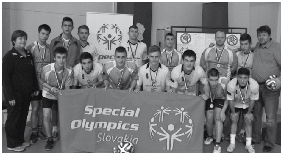
Futbalisti Púchova (v tmavších dresoch) sa stali víťazmi B-skupiny na 22. ročníku Vianočného halového turnaja v unifikovanom futbale v sTC Aréne v Púchove.