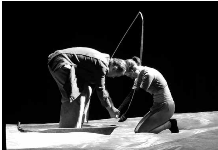
Divadlo M: O rybárovi a zlatej rybke.