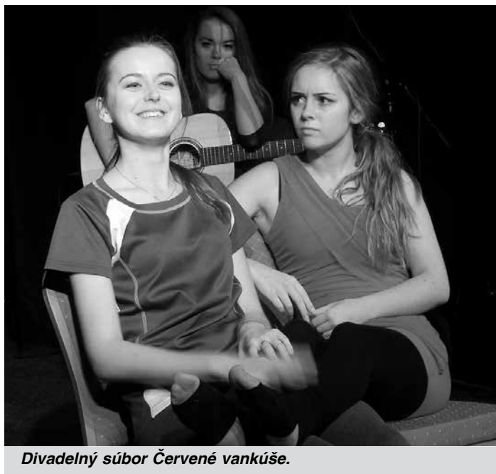
Divadelný súbor Červené vankúše.