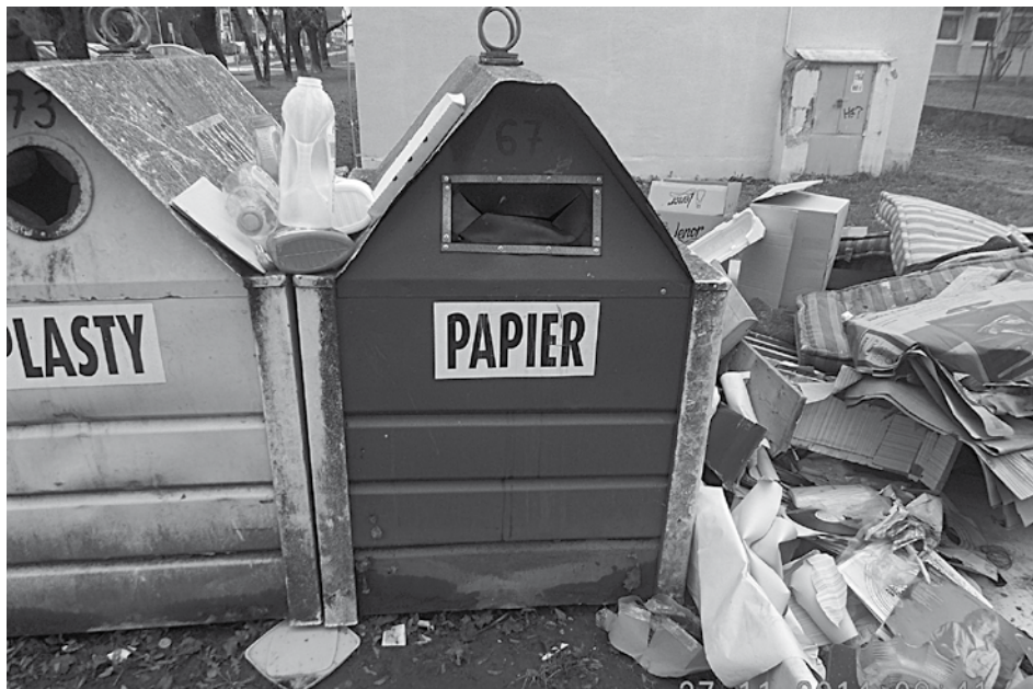
Niektorí Púchovčania si stále mýlia priestory pri kontajneroch so smetiskom...

Hliadka MsP našla okolo pol desiatej večer na Ulici F. Urbánka spať na verejnom priestranstve opitého muža. Po zobudení ho mestská policajti predviedli na oddelenie za účelom zistenia totožnosti, keďže odmietol svoju totožnosť preukázať. Na oddelení odmietol muž spolupracovať s mestskými policajtmi, kládol aktívny odpor pri vykonávaní bezpečnostnej prehliadky a odmietal uposúchnuť výzvy príslušníkov mestskej polície. Preto voči nemu použili mestská policajti donucovacie prostriedky – hmaty, chvaty a služobné putá. Mužovu totožnosť overili na Obvodnom oddelení Policajného zboru v Púchove. Priestupok potrestali pokutou 30 eur, krátko pred 23. hodinou muža z oddelenia prepustili. Vzhľadom na počasie a stálu opitnosť ponúkla hliadka mužovi odvoz do miesta bydliska. Ten to odmietol a trval na tom, že do miesta trvalého bydliska pôjde sám. Mestská policajti spracovali záznamy o predvedení a použití donucovacích prostriedkov.