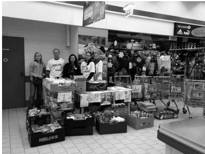
Minuloročná zbierka potravín dopadla nad očakávanie.

ciu už máme trochu zmapovanú. Robíme napríklad tábor pre deti zo sociálne slabších rodín a máme tam určitú „klientelu“, ktorú vieme zastrešiť. Potraviny často dávame aj do rodín, kde