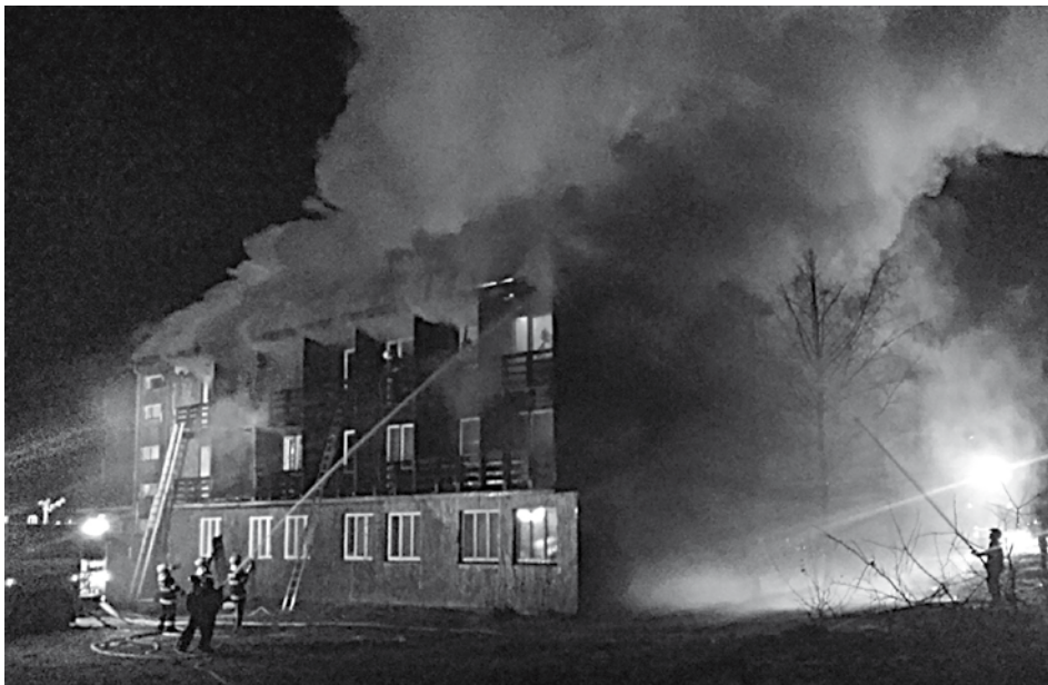
Obyvatelia Beluškých Slatín majú ešte v živej pamäti obrovský požiar Motela Slatina, ktorý požiar prakticky zničil do tla. Minulý týždeň zachvátili plamene hotel Thermal rovnako v Beluškých Slatinách. Zásah hasičov bol mimoriadne rýchly, stačili zhorieť iba štyri izby.