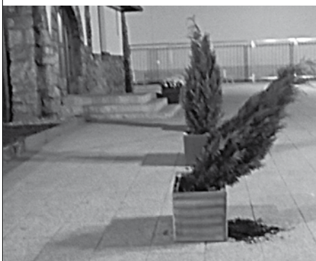
Ani minulý týždeň nedali vandalom pokoj okrasné tuje...

Mestských policajtov upozornila žena, ktorá pri Odháňkach venčila psa, na chlapcov pobehujúcich po streche garáže. Hliadka na mieste našla dvoch chlapcov z Púchova, ktorí však tvrdili, že na streche garáže neboli, údajne tam videli neznámych mladíkov, ktorí mali ujsť keď zbadali prichádzajúcu hliadku mestskej polície. Polícia mladíkov z miesta vykázala.