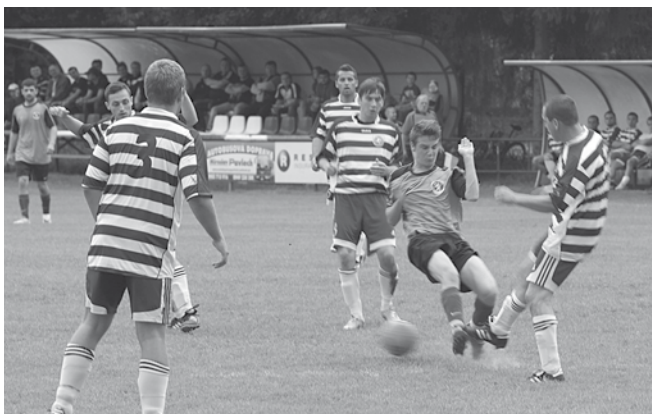
Futbalisti Dolných Kočkoviec (v pruhovaných dresoch) akoby nevedeli pred domácimi priaznivcami ukázať čo vedia.

Ani ďalší dvaja zástupcovia Púchovského okresu si tohtoročnú jeseň do vitríny nedajú. Dvanáste Dolné Kočkovce sú však trochu iný prípad, ako Visolaje. Dolnokočkovania ako keby nevedeli hrať pred vlastnými priaznivcami. Vo svojom útulnom areáli vyhrali zo siedmich stretnutí iba dve a na vlastnom trávniku ich olúpili súper i o neuveriteľných 14 bodov. I preto sú Dolné Kočkovce po jeseni až na samom dne tabuľky domácich zápasov. S výkonom vonku môže v Dolných Kočkovciach vládnuť trochu väčšia spokojnosť, i keď päť privezených bodov tiež nie je žiadne terno. I keď všetci traja zástupcovia okresu Púchov sú naukladaní takmer na dne tabuľky za sebou so zhodným počtom dvanástich bodov, najnižšie v tabuľke je po jeseni Lysá pod Makytou. I preto, že doma zo šiestich zápasov tri prehrala, no najmä preto, že vonku ani raz nevyhrala a priviezla iba tri body za tri remízy. Jedným dychom však treba dodať, že Lysá na súperových trávnikoch nebetónuje, snaží sa o ofenzívny futbal a niekoľko stretnutí prehrala po priebehu, za ktorý by si body zaslúžila.