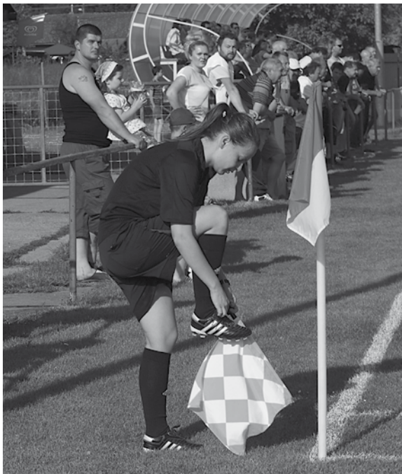
FOTOHUMOR: Džentlmenov plné ihrisko a črievičku si musím zaväzovať sama...