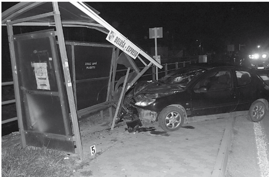
Vodič pri dopravnej nehode, ktorá sa stala minulý týždeň v obci Beluša, zničil autobusovú zastávku.