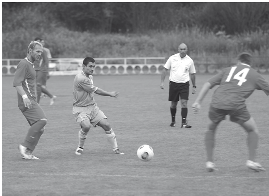
Futbalisti v Beluše v dohrávanom jesennom kole v poslednom tohtoročnom majstrovskom stretnutí na domacom trávniku porazili Chocholnú-Velčice a prezimujú na druhej priečke.