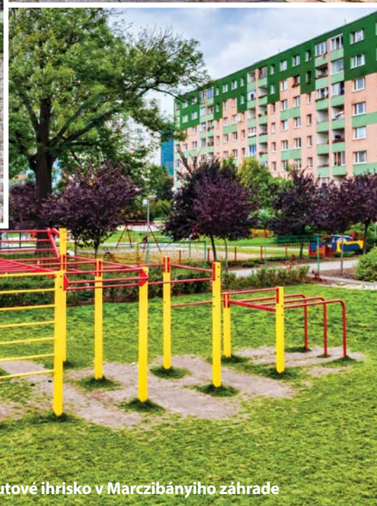
Street work outové ihrisko v Marczibányiho záhrade