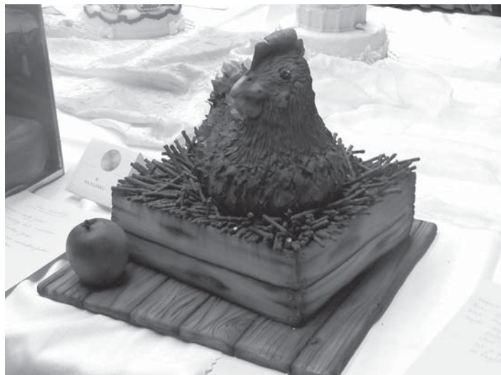
Najkrajšia atypická torta a zároveň víťazná torta celej súťaže „Najkrajšia torta Slovenska“.