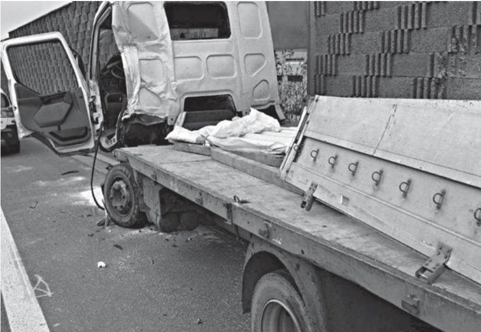
Dopravná nehoda na diaľnici D1 pri Beluši si vo štvrtok dopoludnia vyžiadala ťažké zranenie vodiča nákladného motorového vozidla.