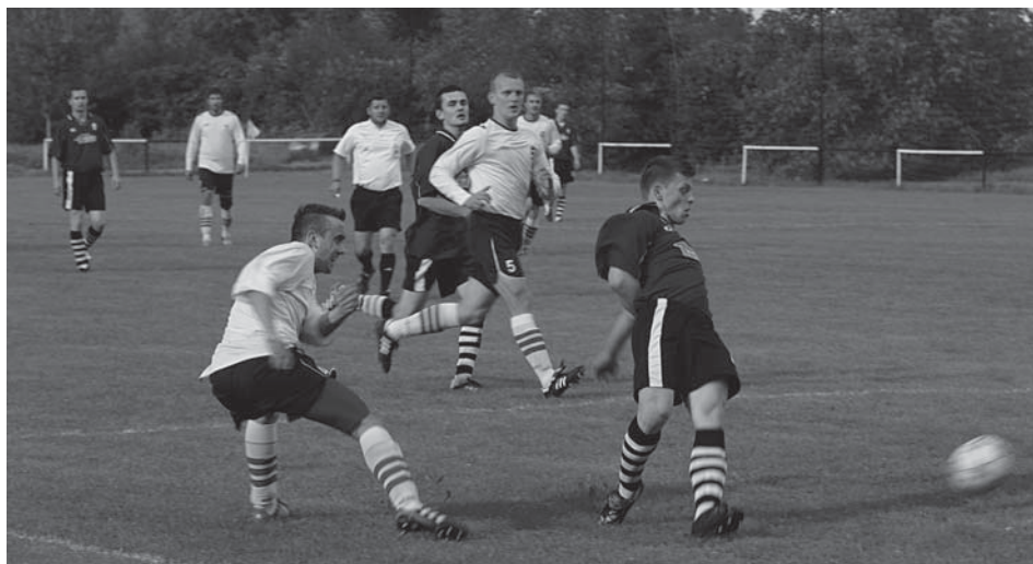
Nováčik zo Streženíc (v tmavom) si v nedeľu v dôležitom stretnutí poradil v oblastnom derby s Ladcami.