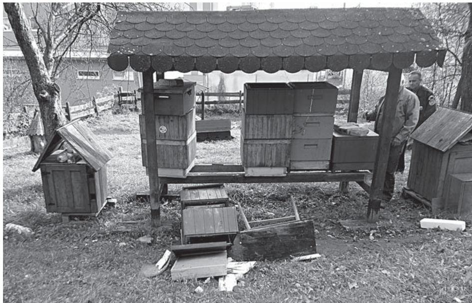
Včelín pri Zdraví stále nedá pokoj niektorým slabomyselným Púchovčanom. Aj v minulom týždni na ňom zanechali neznámi vandali svoju „mentálnu silu“.

Mestských policajtov telefonicky informoval Púchovčan, že prichytil pri sprejovaní vo vnútri bytovky neznámeho mladého muža, ktorý čiernym sprayom znečistil na prízemí výťahové dvere oboch výťahov, ako aj príľahlé steny. Mladík mu síce ušiel, ale na základe jeho popisu ho však hliadka zadržala na Moravskej ulici. Mladík sa k skutku priznal. Pre podozrenie z trestného činu prípad prevzala privolaná hliadka štátnej polície.