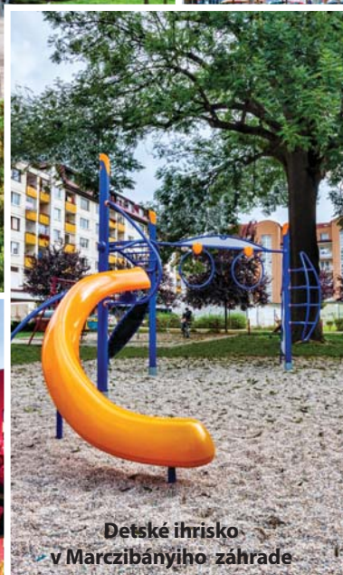
Detské ihrisko v Marczibányiho záhrade