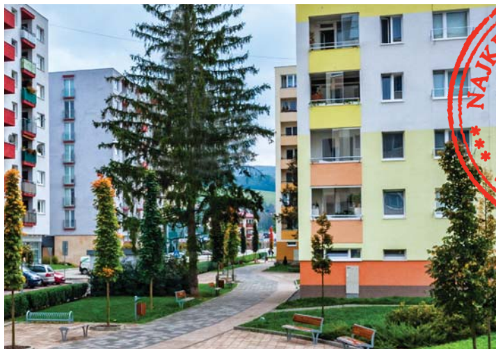
Pešia zóna na Dvoroch