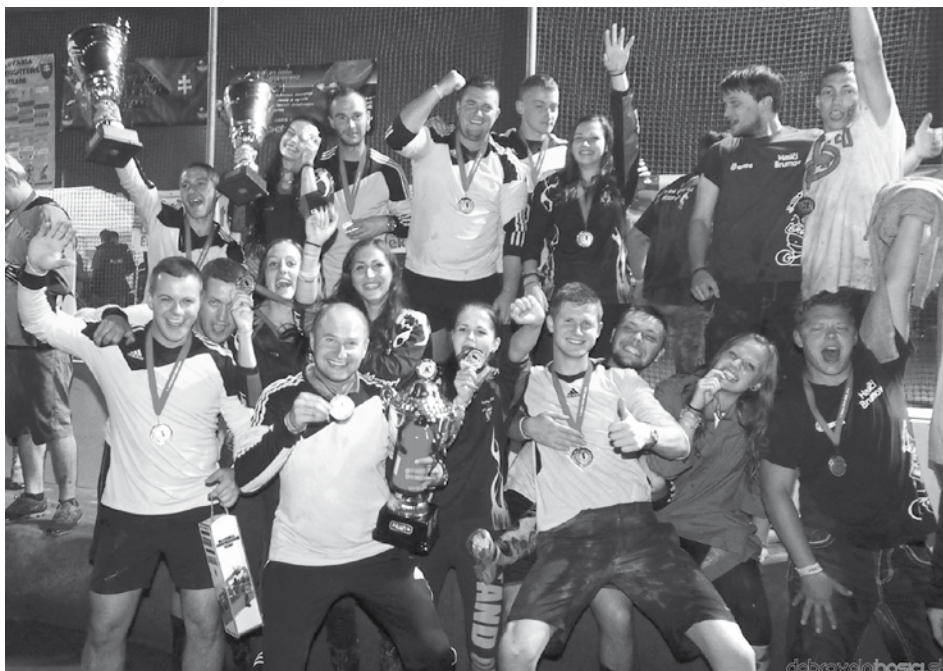
Takto sa Nosičanky a Podhorania tešili z víťazstva v SHML a okres aj Slovensko-moravskú hasičskú ligu úspešne reprezentovali aj v slovenskom Superpohári.

Ženy: 1. Moškovec, 2. Nosice – žabky, 3. Spišská Sobota, 4. Setechov s, 5. Spišský Štvrtok. (pok)