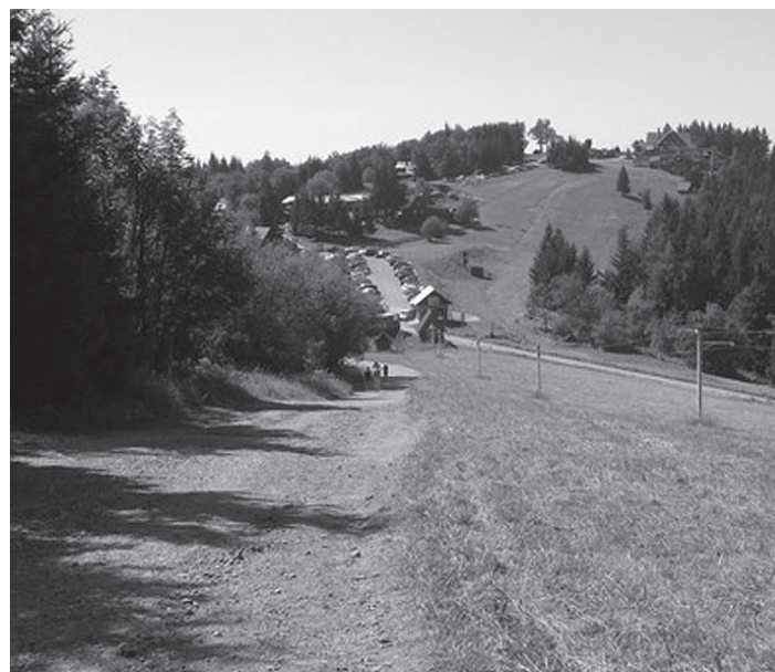
Súčasnou projektom je aj oprava spojnice sedla Kohútka s Hotelom Portáš.

rekreačná osada Javorníky I. A II., ďalšie tri chaty boli priamo na hrebeni už postavené. To všetko bez upozornenia českej strany. Za slovenskou štátnou hranicou je pritom vyhlásená Európsky významná lokalita Beskydy, kryjúca sa s hranicami Chránenej krajinnnej oblasti Beskydy, a je teda nutné pri posudzovaní brať do úvahy i túto časť. To bol dôvod, prečo sme sa voči investícii, vedúcej na štátnu hranicu, ohradili. Slovenskou stranou nie je plne akceptovaný fakt, že na českej