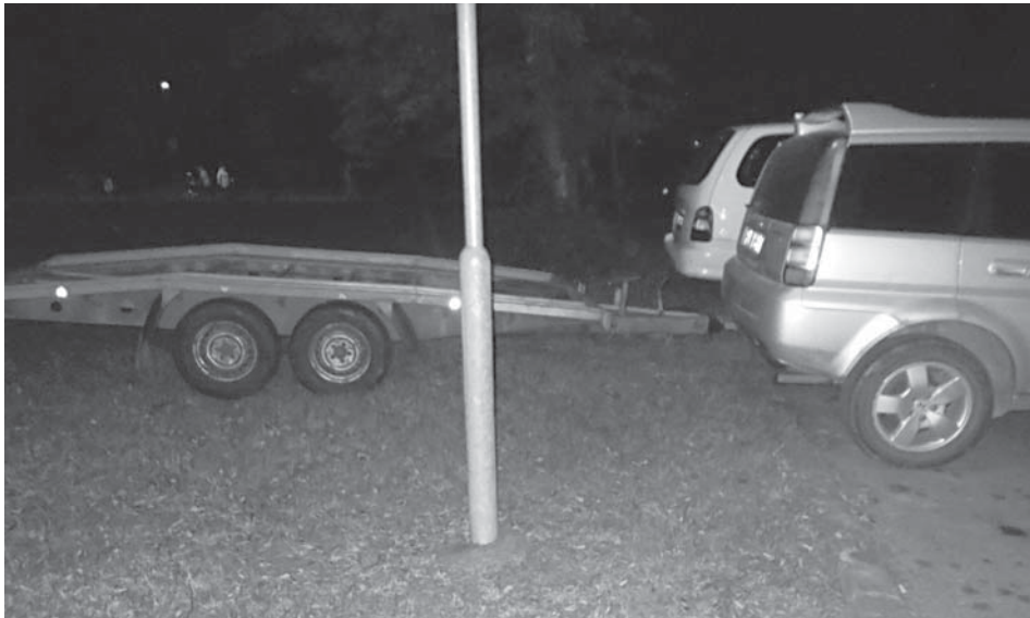
Aj takto parkujú niektorí vodiči v Púchove...