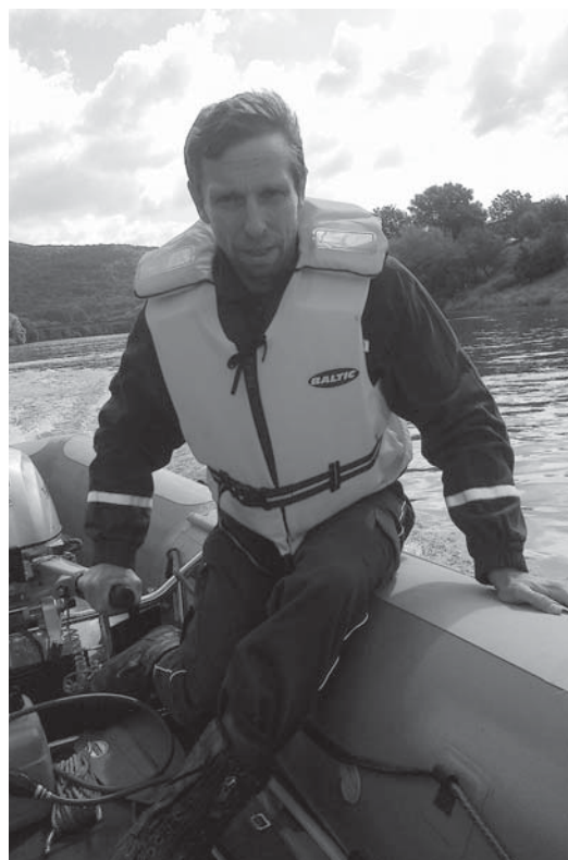
Púchovskí hasiči - záchranári absolvujú aj pravidelný výcvik na vodných plochách.