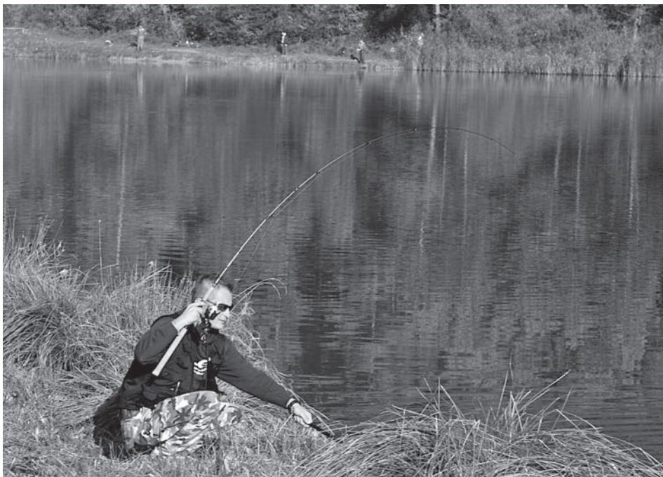
Celoslovenské bodovacie pretek v love rýb udicou na prívlač prilákali na Vodnú nádrž Ihrište 70 rybárov z celého Slovenska.