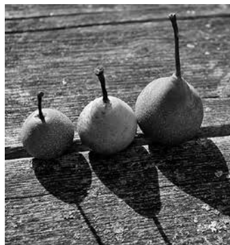
Dobrienka, Medovka a Orešianka - skvelé krajové odrody z Mikušoviec.