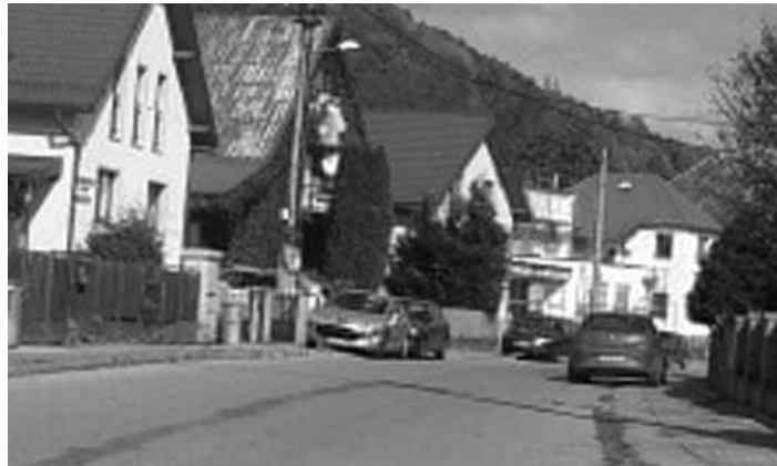
Ulica Janka Kráľa sa stáva ťažko prejazdnu.

ti prebiehajú aj rokovania a pracuje sa na novom cenovom výmere, podľa ktorého by mali zadarmo cestovať mamičky s deťmi a seniori. Koho presne sa budú zľavy týkať, bude jasné čoskoro. Tí, ktorí budú cestovať zadarmo či so