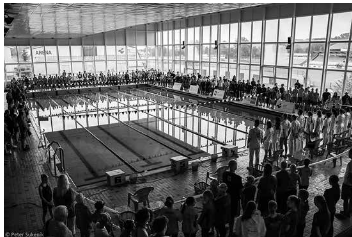
V sobotu 4. októbra sa na púchovskej krytej plavárni uskutočnil už 11. ročník Veľkej ceny Púchova, ktorej sa v tomto roku zúčastnilo 400 plavcov z celého Slovenska.

1. Plavecký oddiel bol kedysi najlepším oddielom v SR. Mal silnú základňu. Dnes je opak pravdou.