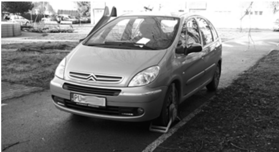
Fantázia niektorých vodičov pri vyhľadávaní parkovacích miest v Púchove nemá hranice...

Za nedodržanie zatváracích hodín bude niesť zodpovednosť prevádzkar baru na Moravskej ulici. Po záverečnej v ňom bolo päť osôb, ktorý podľa telefonického oznámenia rúšili obyvateľov bytovky. Priestupok proti všeobecne záväznému nariadeniu mesta Púchov je v riešení.