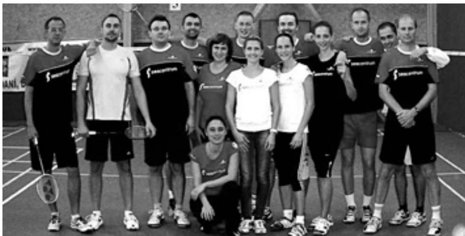
Bedminton v Púchove získava čoraz väčšiu popularitu.