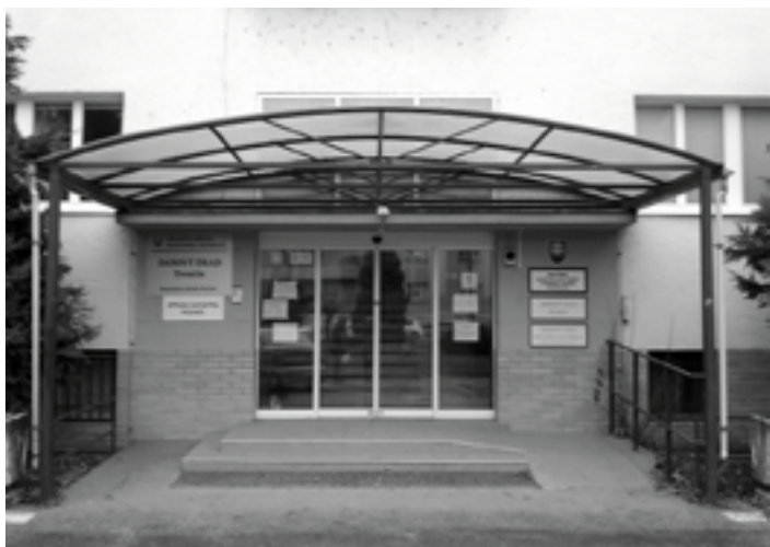
Rodičia detí vo veku 3 - 6 rokov si musia plniť oznamovaciu povinnosť na púchovskom pracovisku úradu práce a sociálnych vecí.

25 rokov). Skupina detí vo veku 3-6 rokov bližšie špecifikovaná nie je.