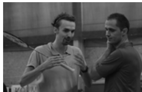
Medzi setmi je každá rada dobrá...