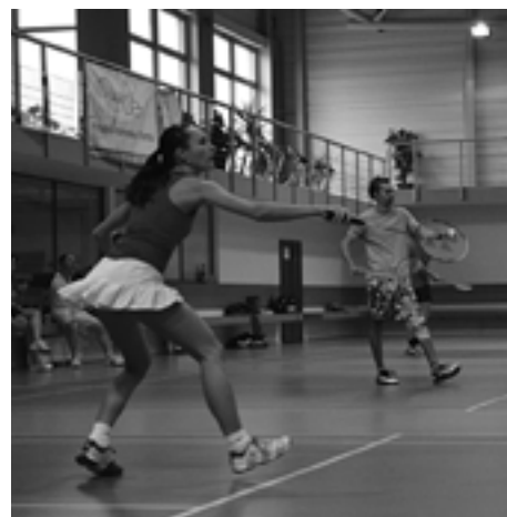
V zápale hry...