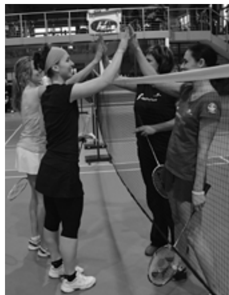
Priateľský „tukes“ po každom zápase je v bedmintonstve samozrejmosťou....