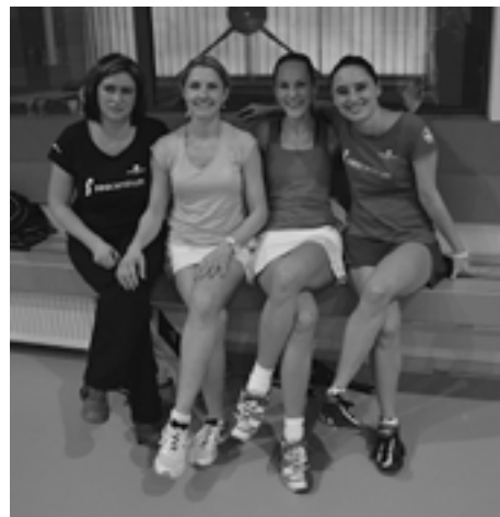
Púchovský bedminton to nie je len o športe, ale predovšetkým o kamarátstve.

Kto by chcel prísť Púchovčanov podporiť na najbližšie kolo 4. ligy, bude sa konať v športovej hale v Ilave, v nedeľu 2.2. 2014 o 9,00 hod. Sily sizerajú BK Racquets Púchov A-čko aj B-čko s B-čkom TJ Sokol Ilava. (KT)