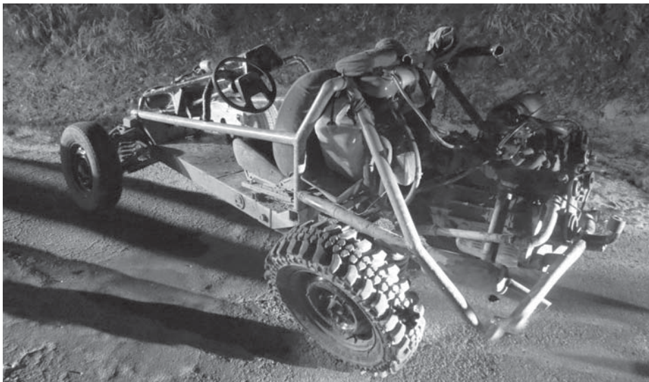
Mladík v Zubáku si pekne zavaril. Riadil automobil bez značiek a navyše mal v dychu viac ako jedno promile alkoholu.

Hliadka MsP musela upozorniť personál hotela na sídlisku Dvory na hluk šíriaci sa z tamojšieho baru. Barmanku vyzvala k stíšaniu produkcie a uzatvoreniu svetlíkov baru.