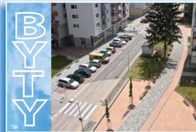
Výstavba nových nájomných bytov.