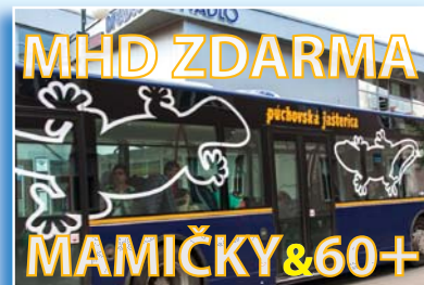
MHD zdarma pre mamičky s deťmi a ľuďi 60+.