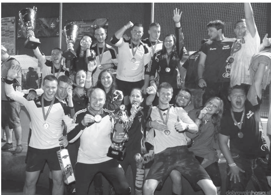
Majstri a majsterky, alebo spoločná fotografia tohtoročných víťazov Slovensko-moravskej hasičskej ligy mužov Podhoria a žien Nosíc.

V ženskej súťaži bola SMHL tento rok mimoriadne vyrovnaná. Už od začiatku bolo jasné, že o prvenstvo sa pobijú predovšetkým Nosice, Dežerice a Moškovec, svoje chcela povedať do konečného poradia aj Nedašova Lhota. Nosičanky sa v čele seriálu striedali v čele s Dežericami i Moškovcom, po sérii víťazstiev v Horeničkej Hôrke, Podlužanoch a Podhorí sa v čele usadili Dežeričanky. V Trstí Nosičanky stiahli ich náskok na tri body a vo finálovom preteku v Ďurďovom Nosičanky zvíťazili. Dežerice skončili až tretie a to ich odsunulo v celkovom poradí na druhé miesto. V ženskej