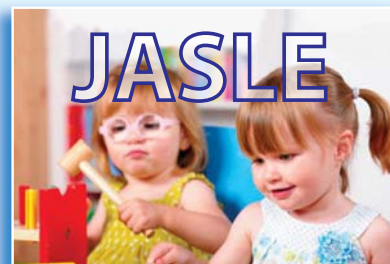
Otvorenie detských jasí po 25 rokoch.