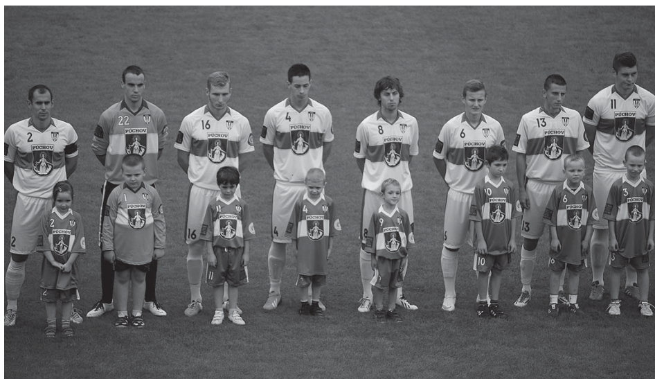
Na zápas s Levicami nastúpili púchovskí futbalisti v nových dresoch, ktoré dokumentujú, že Mesto Púchov preberá plnú zodpovednosť za budúcnosť púchovského futbalu.

Aktuálne informácie o otváracích hodinách nájdete na www.mskpuchov.sk .