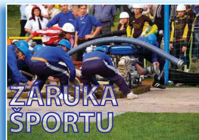
Prevzatie výkonnostného športu pod mesto.