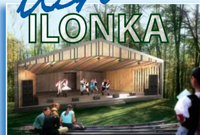
Úplná obnova letného amfiteátra na Ilonke.

„Ostatná skupina osobností, ktorých som oslovil o angažovanie sa vo verejnom živote. Všetkých, na koho sa pozeráte, si vážim. Verím, že v meste vidno aj ich prácu. Podporili 6 priorít programu Najkrajšie mesto Púchov, silné mesto. Máte možnosť o nich diskutovať. O plusoch i mínusoch. Spájame ľudí, ktorí dokážu prinášať viditeľné výsledky. A posunúť život v našom meste dopredu.“