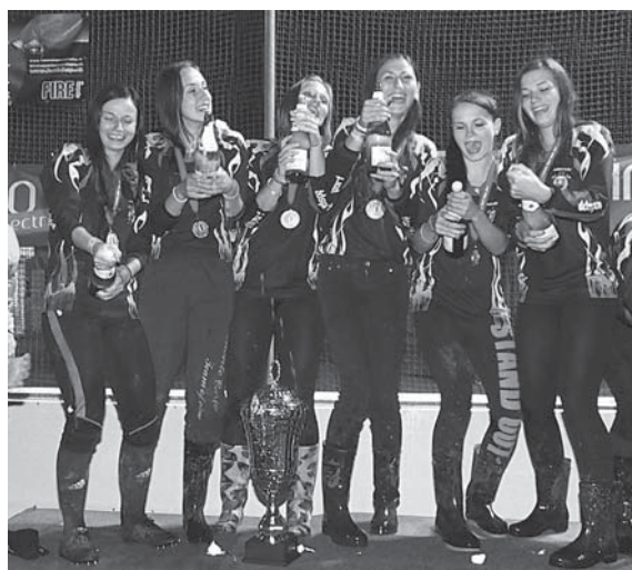
Nosické žabky čakali, čakali a vo finálovom preteku udržiavali druhú pozíciu. Tohtoročnú Slovensko-moravskú hasičskú ligu vyhrali o jediný bodík...

Rekordy v Slovensko-moravskej hasičskej lige držia hasiči Podhoria, ktorý v minulom roku absolvovali víťazný útok v Ihrišti za 13,13 sekundy. Medzi ženami držia rekord dievčatá Moškovca. Zabeľho rovnako vlani v Podlužanoch a dosiahli čas 15,53 sekundy. (pok)