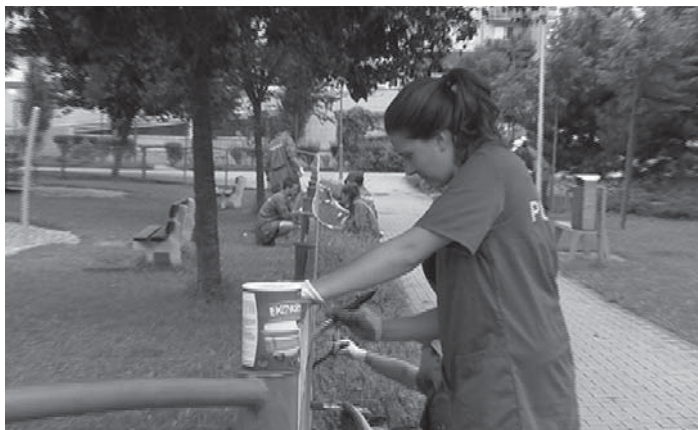
Po dobrovoľníkoch zostalo v Púchove množstvo odvedenej práce - okrem iného aj natreté oplatenie detského ihriska.