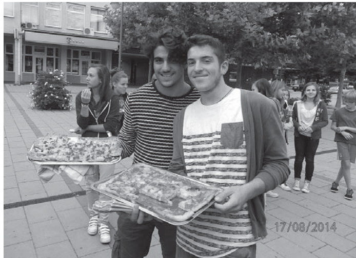
Pravá talianska pizza a majstri kuchári z Apeninského polostrova.