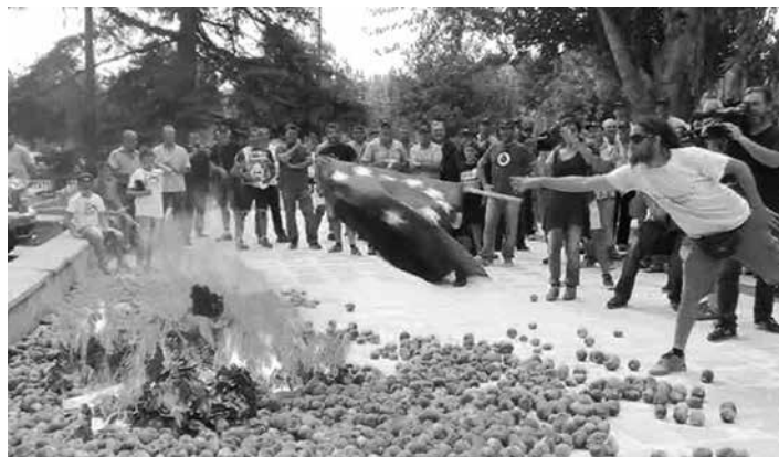
Katalánski farmári na znak protestu pálili na vlastnej úrode broskýň vlajky Európskej únie.