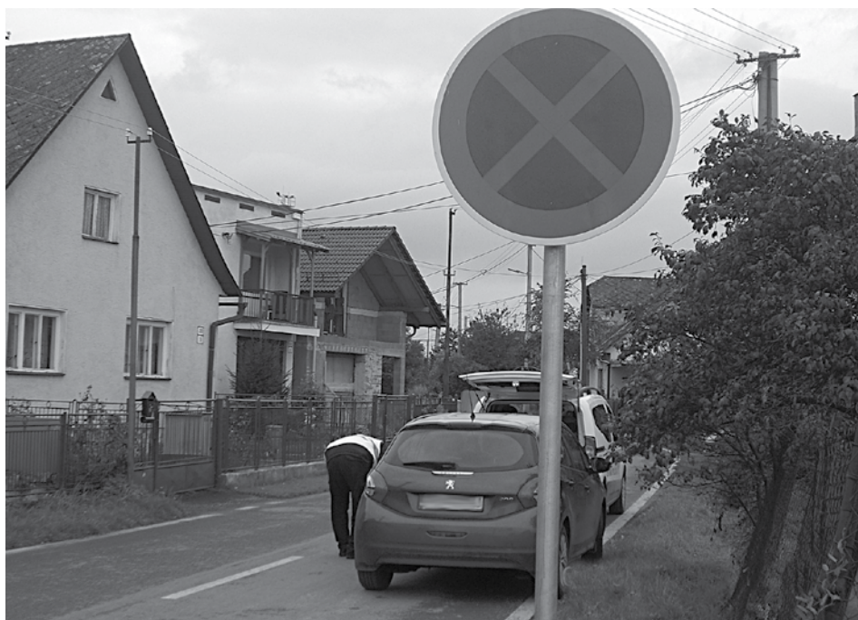
Vodiči sú nepoučiteľní. Nerešpektovanie dopravného značenia v Púchove mestská polícia netoleruje.

Na oddelenie mestskej polície zatelefonovala žena zo Svätoplukovej ulice v Púchove, podľa ktorej má v byte neznámy zápach, z ktorého má rôzne zdravotné problémy. Hliadka nezistila v byte žiadny cudzí zápach s výnimkou potuchliny z nevyvetranej miestnosti. Žene odporučili, aby si vyvetrala.