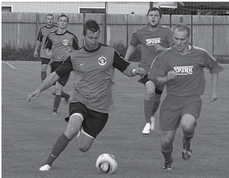
Až v štvrtom kole 6. ligy mužov sa futbalisti Visolají tešili z prvého víťazstva v tomto súťažnom ročníku. Doma si poradili s Tuchyňou.