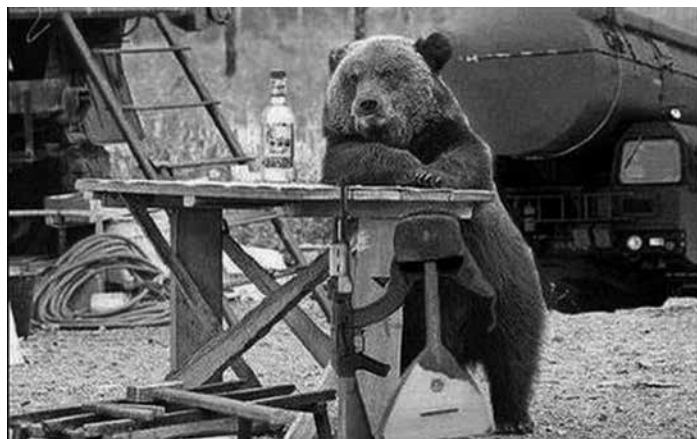
V súvislosti so sankciami uvalenými na Rusko kolujú internetom aj vtipy...na obrázku ruský medveď čakajúci na sankcie z EÚ.