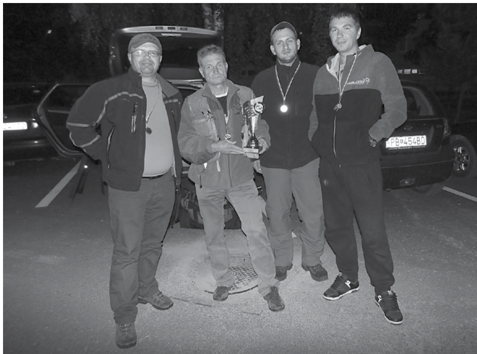
Družstvo pretekárov v love rýb na muchu z Púchova sa stalo víťazom divízie a vybojovalo si postup do 2. celoslovenskej ligy.