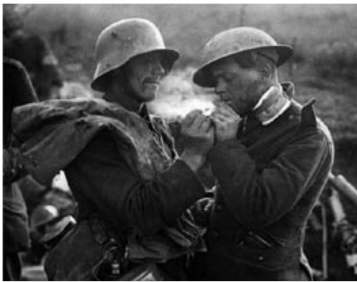
Dôkaz toho, že vojaci veľmi bojovať nechceli. Nemecký vojak pripaluje cigaretu anglickému zajatcovi.