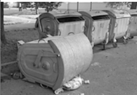
Výsledok „hrdinských“ činov podguráženej mládeže...

Mestských policajtov upozornili na umiestňovanie stavebného odpadu do kontajnerov na Rastislavovej ulici v Púchove. Preverenie zistilo, že kovový a cementový odpad uložil muž z Moravskej ulice. Mestskí policajti mu nariadili okamžite odstrániť stavebný materiál z kontajnera. Zároveň muža vyzvali na podanie vysvetlenia. Priestupok je v riešení.