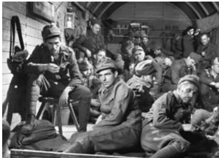
Záber z filmu Paľa Bielika.

Útok na kasárne sa začal okolo 11. hodiny večer, pred piatou hodinou ráno sa jednotkám pplk. Marxa podarilo obsadiť kasárne. Ešte do rána sa mestom Kragujevac ozývali ojedinelé výstrely, to však