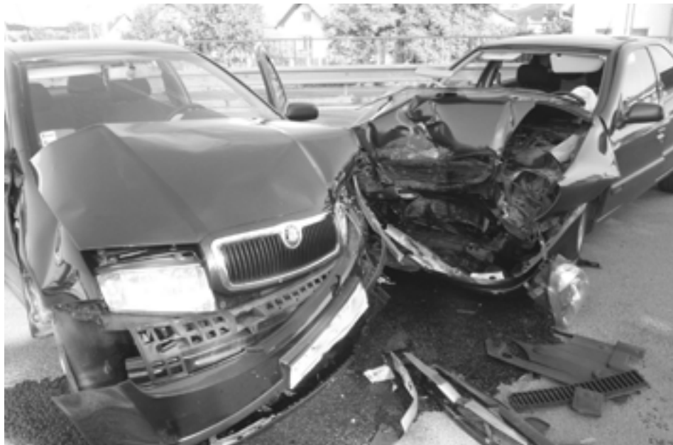
Dopravná nehoda, ktorá sa stala v sobotu 2. augusta popoludní v Beluši, si vyžiadala zranenie jedného človeka.