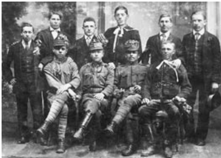
Odvedenci 71. drotárskeho pluku.

71. peší pluk sa do vojny zapojil už v roku jej začiatku. Počas bojov o Lublin stratil okolo polovice vlastných - mužstva aj veliteľov. Po doplnení bojoval v ťažkých podmienkach na prelome rokov 1915 a 1916 proti ruskému cárskemu vojsku v Karpatoch a pol druhá roka v zákopovej vojne v Haliči. V novembri 1916 bol pluk presunutý na taliansky front. Na jeseň roku 1917 bojoval v jednej z najťažších bitiek vojny, pri rieke Piave.