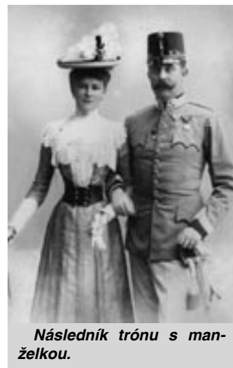
Následník trónu s manželkou.

Prvý globálny vojenský konflikt sa skončil v novembri 1918. Bilancia: desať miliónov mŕtvych a ďalších 20 miliónov zranených. K tomu treba pripočítať nešťastie rodín, ktoré stratili živiteľov, hlad, chudobu a spúšť v miestach, ktorými prešiel front. Vojna kruto vstúpila aj do životov miliónov obyčajných slovenských rodín. Z územia dnešného Slovenska bolo v rokoch 1914 až 1918 zmobilizovaných približne 400 tisíc vojakov. Jedna pätina z nich sa domov už nikdy nevrátila a rovnaký počet ostal trvalo zmrzačených. Bojovalo sa aj na Slovensku. Od novembra 1914 do mája 1915 prechádzal front dnešnými okresmi Bardejov, Svidník, Stropkov, Medzilaborce, Humenné a Snina. Začiatkom roka 1915 tadiaľto ruské velenie viedlo dve generálne ofenzívy