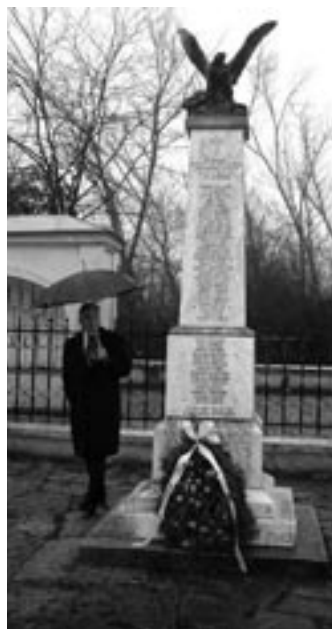
Pamätník 44 obetiam Kragujevackej vzbury bol postavený v roku 1928.