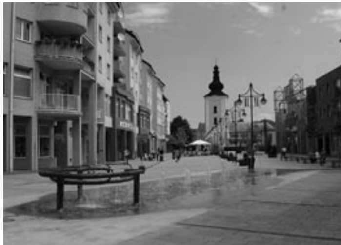
Pešia zóna a príľahlá Marczibányiho záhrady sú dva púchovské tromfy pre návštevníka Najkrajšieho mesta Slovenska za rok 2013.