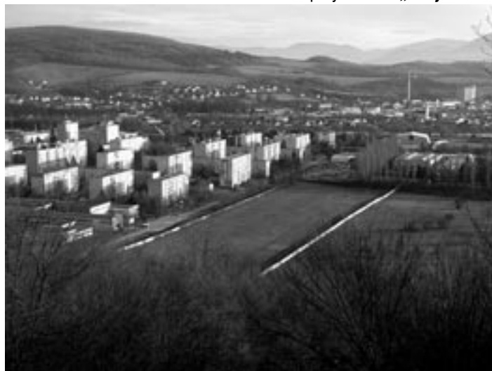
Pozemky o rozlohe cca 30 000 m 2 predala Považská vodárenská spoločnosť pred piatimi rokmi.