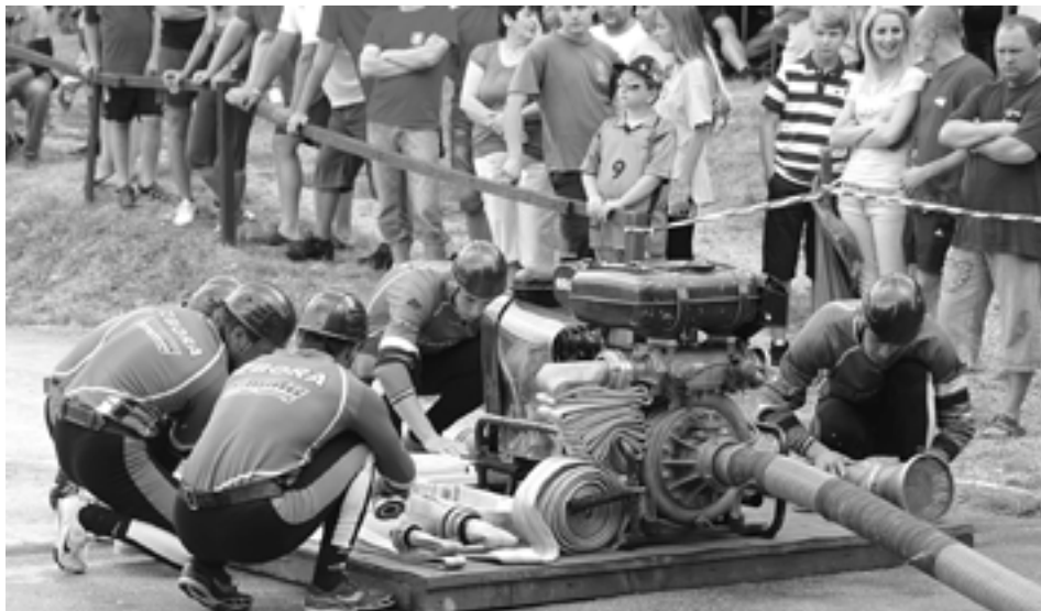
Dobrovoľní hasiči Zbory skončili na domácej trati na peknom štvrtom mieste a posunuli sa do elitnej desiatky SMHL.