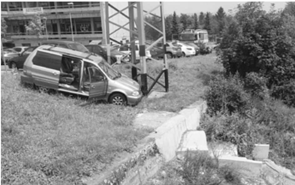
Kovová konštrukcia stĺpa zabránila spadnutiu automobilu do potoka v Lednických Rovniach. Následky nehody odstraňovali púchovskí hasiči.

Hliadka MsP zasahovala na základe telefonického oznámenia na Námestí slobody, kde mali na nakladacej rampe sedieť tri pravdepodobne neplnoleté dievčatá, ktoré konzumujú alkohol. Hliadka na mieste našla tri dievčatá bez občianskych preukazov, ktoré mali so sebou načatú pollitrovú fľašu vodky. Všetky tri predviedli na oddelenie MsP za účelom zistenia totožnosti. Dve Púchovčanky a jedna dievčina z Lysej pod Makytou absolvovali aj orientačnú dychovú skúšku s negatívnym výsledkom. Keďže trojica dievčat sa nedopustila priestupku proti všeobecne záväznému nariadeniu mesta, z oddelenia ich prepustili bez toho aby ich sankcionovali.