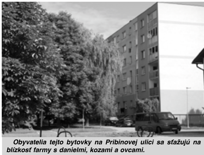
Obyvatelia tejto bytovky na Pribinovej ulici sa sťažujú na blízkosť farmy s danielmi, kozami a ovcami.

Pália vás otázky týkajúce sa diania v meste, na ktoré ste zatiaľ nedostali odpoveď? Spýtame sa ich za vás! Označené heslom „Horúča linka“ nám ich posielajte na adresu Púchovské noviny, Námestie slobody 1401, 020 01 Púchov alebo mailujte na adresu: puchovskenoviny@centrum.sk