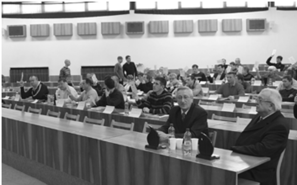
Konferencie Oblastného futbalového zväzu v Považskej Bystrici sa nezúčastnili zástupcovia deviatich oddielov a klubov z Púchovského okresu. O smerovaní oblastného futbalu tak za nich rozhodoval niekto iný...