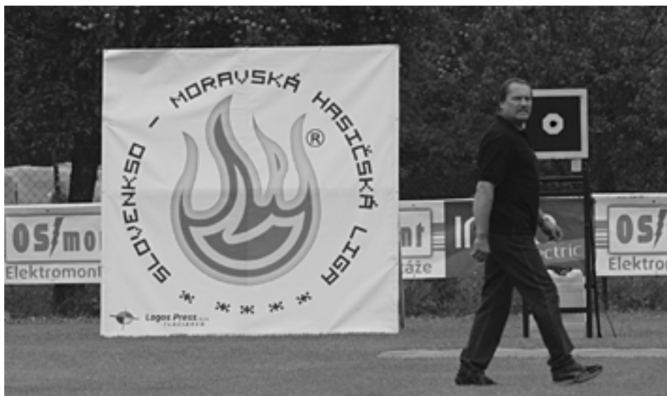
Snem Slovensko-moravskej hasičskej ligy v Podhorí schválil predbežné „noty“ súťaže na tento kalendárny rok.