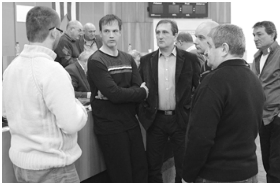
Diskusia regulárnosti či neregulárnosti jedného z kandidátov za okres Púchov narušila pokojný priebeh Konferencie ObFZ.

So svojim štvorročným pôsobením vo futbalových funkciách je Panák spokojný len čiastočne. Ako predsedu športovoteknickej komisie Slovenského futbalového zväzu ho mrzí, že stále nie je schválený nový súťažný poriadok. „Ja som ho vytvoril, prebehlo aj pripomienkové konanie po celom Slovensku. Teraz sa čaká už len na právnikov, aby mu dali právnu podobu a musí ho schváliť Výkonný výbor Slovenského futbalového zväzu,“ priblížil Panák. Ako člena Výkonného výboru Západoslovenského futbalového zväzu ho mrzí schválená podoba reorganizácie futbalových súťaží. Ak by totiž skončili napríklad Majstrovstvá regiónu tak, ako dopadla tabuľka po polovici súťaže, v budúcoročnej tretej lige by neboli ani Lednické Rovne, ani Beluša a ani Domaníža. „Trápia ma útvary talentovanej