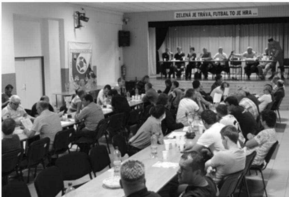
Pohľad na účastníkov aktívu ŠTK v Plevníku.