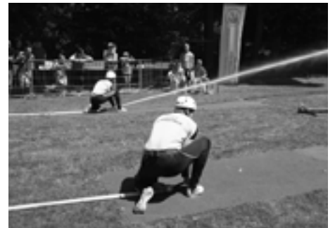
Pravý prúd Podhoria netečie. A to bolo zlé znamenie...