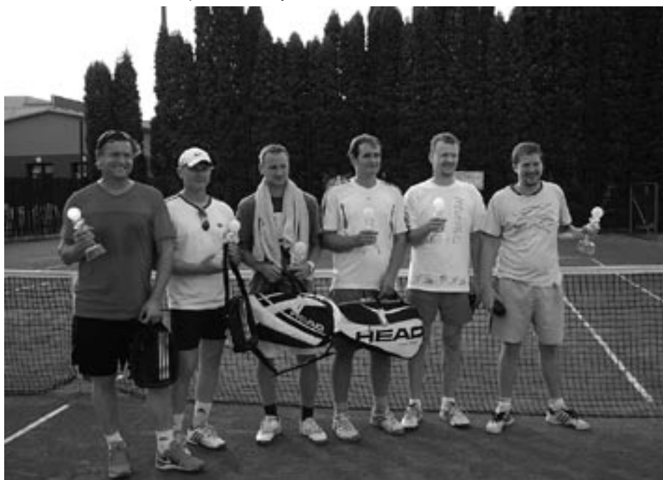
Víťazné páry na 6. ročníku turnaja štvorhier Púchovskej ATP ligy tenistov.