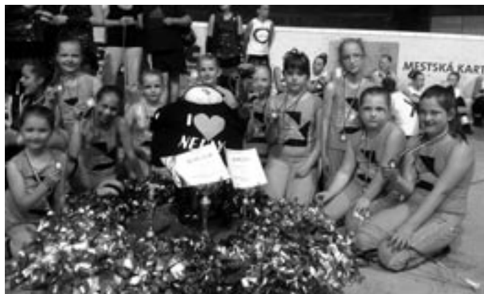
O medailovú žatvu pre CVČ Včielka sa tento rok opäť postaral mažoretkový súbor NELLY.