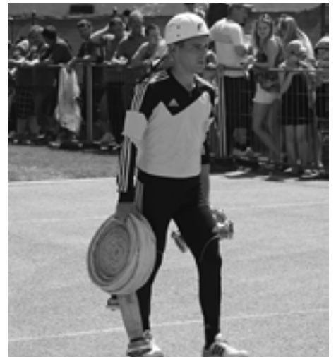
... a následné sklamanie po útoku.