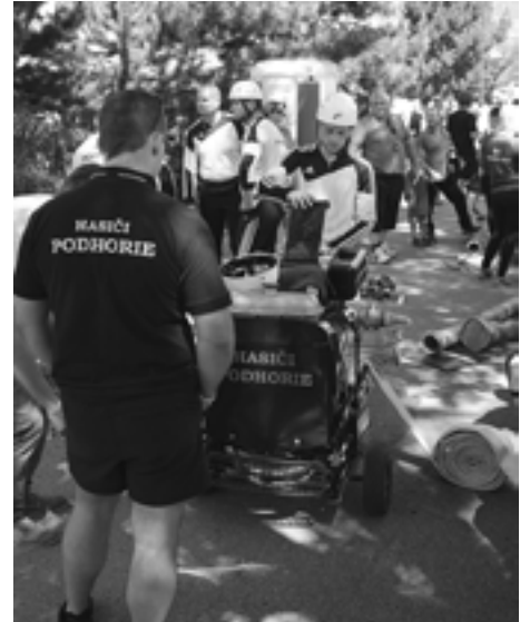
Podhorania počas prípravy striekačky. Vtedy ešte netušili, že sa im útok nevydarí...

V sobotu 19. júla si dajú hasiči SMHL stretnutie v Zbore a o deň neskôr premiérovo aj v Dohňanoch. (pok)