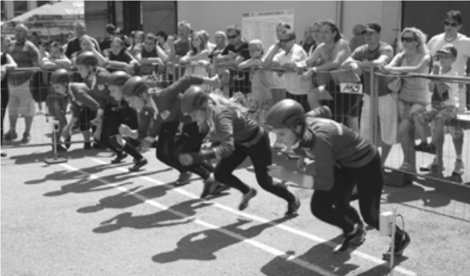
Dievčatá Horenickej Hôrky podali v takmer domácich podmienkach výborný výkon.