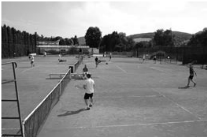
Štyri tenisové kurty v areáli TK Púchov boli v plnej permanentii takmer deväť hodín.