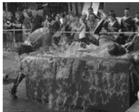
Pri ponorení savice predvádzali hasiči Zbory figúry, za ktoré by sa nemuseli hanbiť ani akvabely...

V najbližšom 6. kole privíta účastníkov Slovenskomoravskej hasičskej ligy v sobotu 12. júla hasičský areál v Lednických Rovniach, nasledovať budú preteky v Zbore (19. 7.) a premiérové v Dohňanoch (20. 7.). (pok)