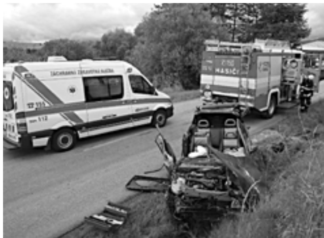
Lentá sezóna prináša so sebou tradične viac dopravných nehôd. Aj takto môže dopadnúť nepozornosť za volantom.

K ďalšej dopravnej nehode vyrážali púchovskí hasiči o dva dni neskôr 2. júla do Dohnian. Na štátnej ceste I/49 narazil dodávkový automobil do stromu. Nehoda sa obišla bez zranení, jej následky likvidovali štyria hasiči z Hasičskej stanice v Púchove.