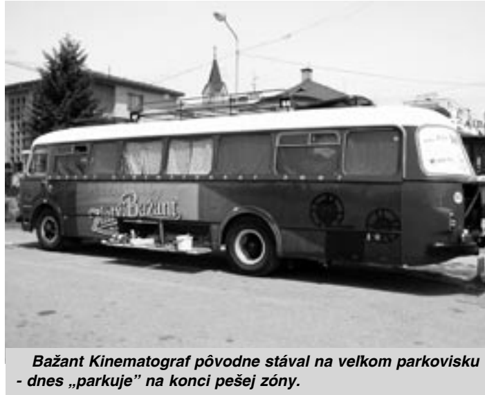
Bažant Kinematograf pôvodne stával na veľkom parkovisku - dnes „parkuje“ na konci pešej zóny.