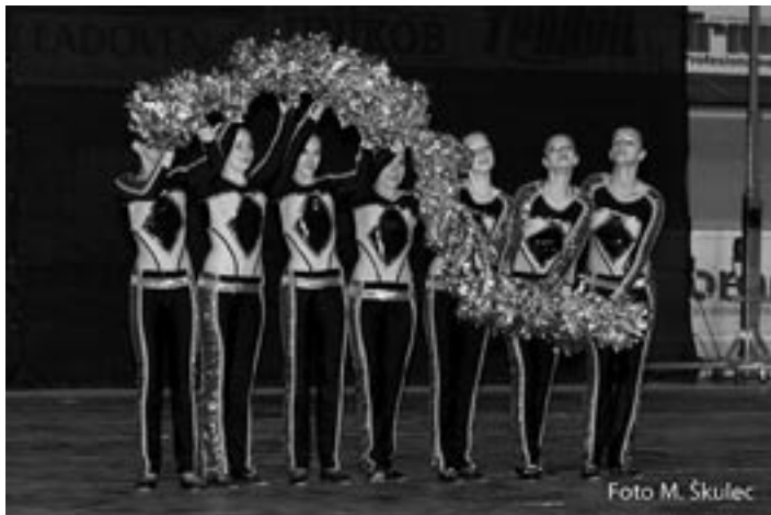
Majsterky Slovenska - sedemčlenná zostava junioriek v kategórii POM - POM