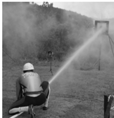
Ani výborných 13,37 sekundy na pravom prúde Brumovu na víťazstvo nestačili. Na ľavom prúde ukázala časomiera 14,40...