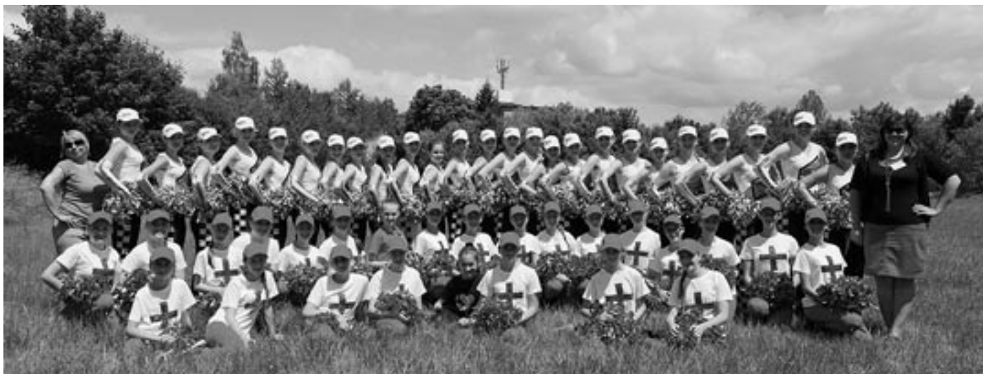
Veľké formácie junioriek a senioriek vybojovali zhodne druhé miesta a tituly vicemajsteriek Slovenska.