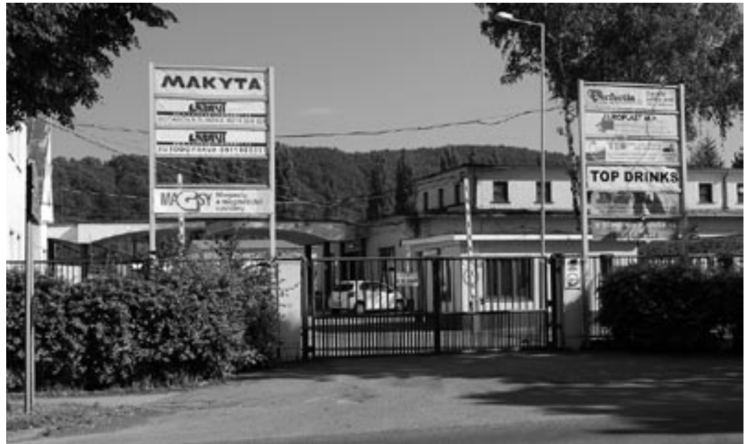
Za touto bránou sa nachádza nová autobusová zastávka „Púchov - Makyta“, ktorá bude v prevádzke od pondelka 7. júla.