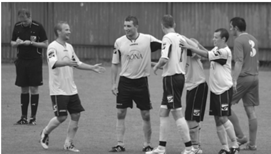
Futbalisti Lednických Rovní budú okres spolu s Púchovčanmi reprezentovať v tretej lige.