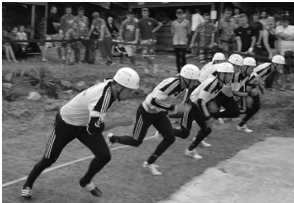
Štartuje útok víťaza SMHL - hasičov z Podhorja. V Ihrišti s prehľadom zvíťazili časom 13,73 sekundy a upevnili si vedenie v seriáli SMHL.