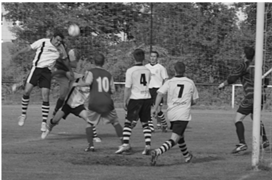
Streženie po zaváhaniach v závere súťaže potvrdili svoje víťazstvo v oblastnej lige až v poslednom kole poltuctovým víťazstvom nad Jasenicou.