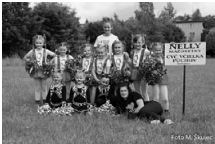
Miniformácia detí POM - POM s choreografiou Červené čiapky získala majstrovský titul.