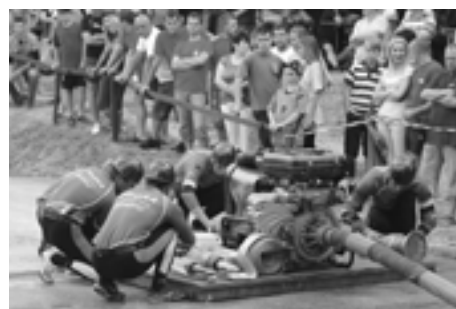
Hasičom Zbory patrí po piatich kolách v SMHL solídne šieste miesto.