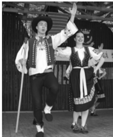
Program Ženci a žnice v podaní FS Váh zaujal divákov i porotu.