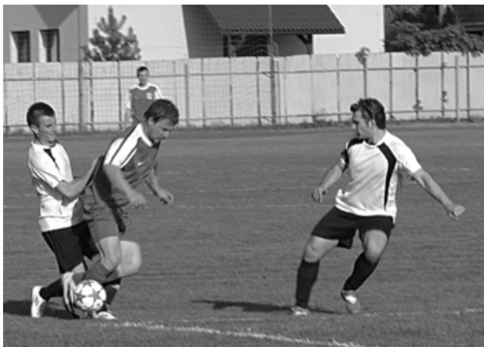
Lysá pod Makytou (v bledých dresoch) mnoho bodov zo súperových ihrísk nepriniesla. Jedným z nich bol v tomto prípade z Visolají, kde však Lysá viedla už 2:0, a tak v podstate dva body stratila...

2. kolo: Lysá pod Makytou – Malé Lednice 1:0