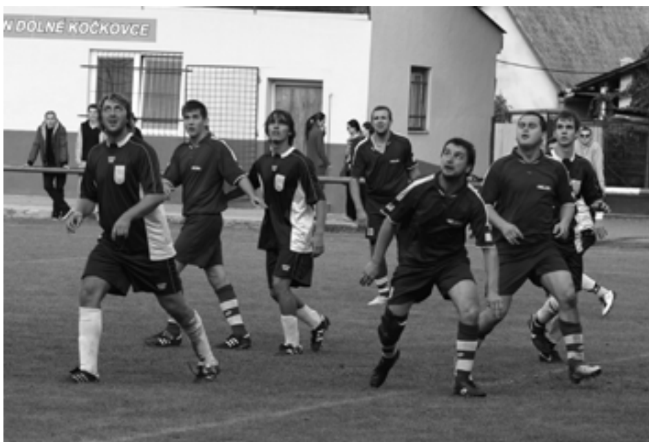
Symbolický záber z jesennej časti - futbalisti Dolných Kočkoviec pozerajú do výšiek... Ešte sa síce tých úplne najvyšších priečok tabuľky nedotkli, no jarný progres mužstva bol očividný...