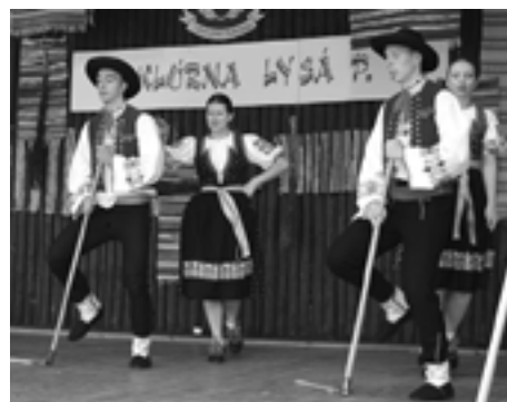
... porote sa však najviac páčili Púchovčania.