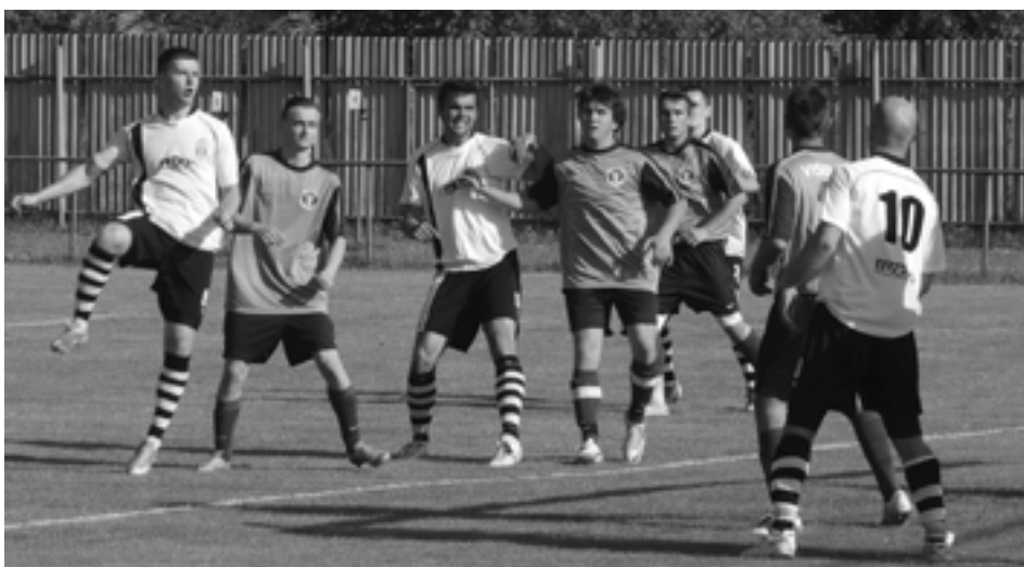
Visolaje sú jediným mužstvom súťaže, ktoré doma neprehralo, no zvonku mnoho bodov nepriniesli.

1. kolo: Visolaje – Jasenica 6:2 (Peter Mišutka,