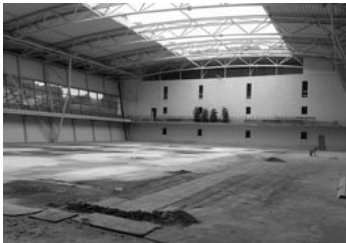
Najbližšie by sa dokončenia mala dočkať multifunkčná športová hala s bežeckým oválom.

lote 32 stupňov a po jeho obvode budú sedacie lavice, z ktorých pôjdu masážne trysky a chrlíče vody. Návštevníci si v ňom môžu posediť a dopriať toľko oddychu,