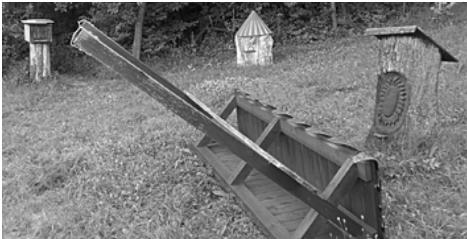
Vandalom v Púchove neodolal ani prístrešok včelnice Centra voľného času...

Hliadka MsP preverovala telefonické oznámenie, podľa ktorého v záhradkárskej osade Zábreh vysypali odpad po výkopových prácach do rokliny. Hliadka na mieste našla muža z Púchova, ktorý zo svojho pozemku vyviezol nie stavebný odpad, ale zeminu zo svojho pozemku a vysypal ju do rokliny. Odporučil mu to predseda spolčenstva záhradkárov.