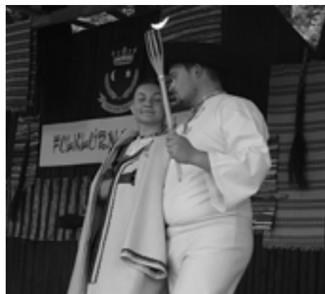
Pôsobivý program predstavil aj FS Považan z Považskej Bystrice...