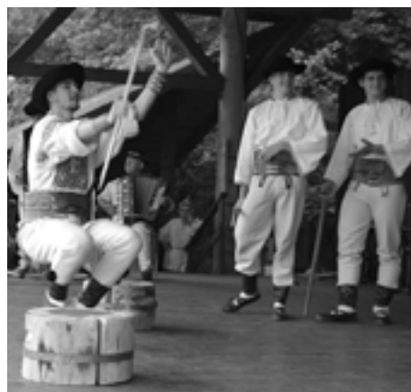
Vystúpenie FS Jánošík z Partizánskeho.