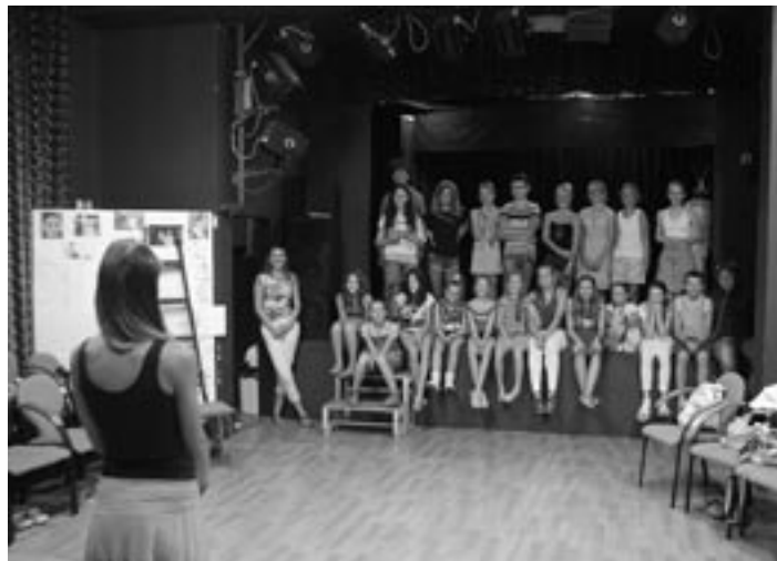
Vlani deti v divadelnom tábore nacvičili muzikál „Neberte nám princeznú“ pre Nelu Pociskovú.

horúčavách len tancovať, čaká ich oveľa bohatší program, pretože budú objavovať čaro tradícií, akými je pre Púchov tak typická modrotlač, čipky, piesne a krásna príroda. Na záver predvedú svoju