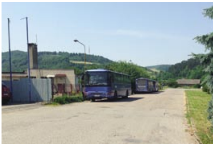
Prímestské autobusy SAD parkujú kade-tade. Najnovšie si našli „útočisko“ v blízkosti Business Centra na Streženickej ceste.