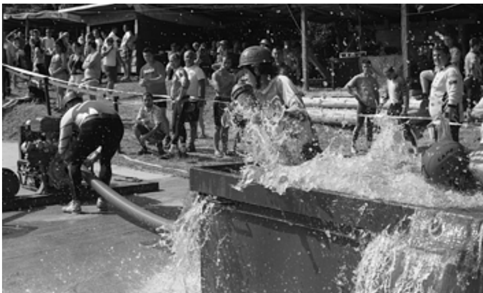
Hasičom Lednických Rovní patrí po treťom kole v SMHL až 16. priečka. Postavenie si budú chcieť vylepšiť už počas série štyroch podujatí v Púchovskom okrese.

Priebežné poradie po troch kolách: 1. Podhorie – 48 bodov, 2. Brumov B – 46 bodov, 3. Ihrište – 32 bodov, 4. Zbora – 30 bodov, 5. Stupné – 28 bodov, 6. Malá Bytča – 27 bodov, 7. Bobrovček – 19 bodov, 8. Poľný Kesov – 17 bodov, 9. Vrbětice – 17 bodov, 10. Nosice – 16 bodov, 11. Trstie – 14 bodov, 12. Brumov A – 14 bodov, 13. Dohňany – 12 bodov, 14. Mikušovce – 12 bodov, 15. Horná Breznica – 11 bodov, 16. Lednické Rovne – 11 bodov, 17. Pravotice – 10