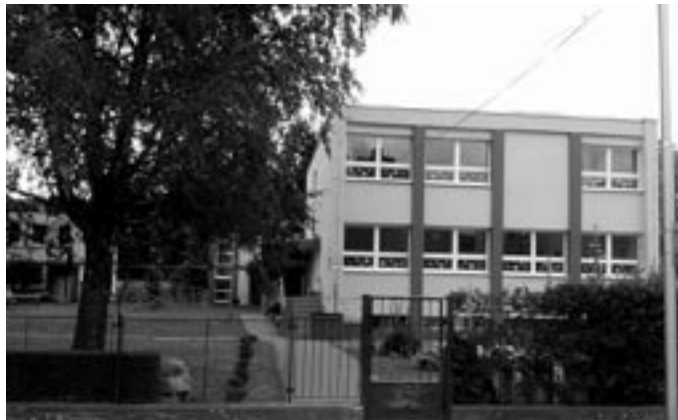
Zrušením zastávky pri Makyte sa deťom zo Špeciálnej základnej školy predĺžila trasa z a do školy o bezmála štyristo metrov.

tvorí jednu stotinu z 800 tisíc EUR, ktoré teraz Trenčiansky samosprávny kraj získal ako vratku od SAD Trenčín. TSK zrušil zastávku bez toho, aby dal ľuďom vopred vedieť, a bez toho, aby informoval mesto, odkedy ju ruší. A hlavne pre čiastku, ktorá je úplne banálna. Ja sa pýtam, kam sa prelievajú peniaze v Trenčianskom sa-