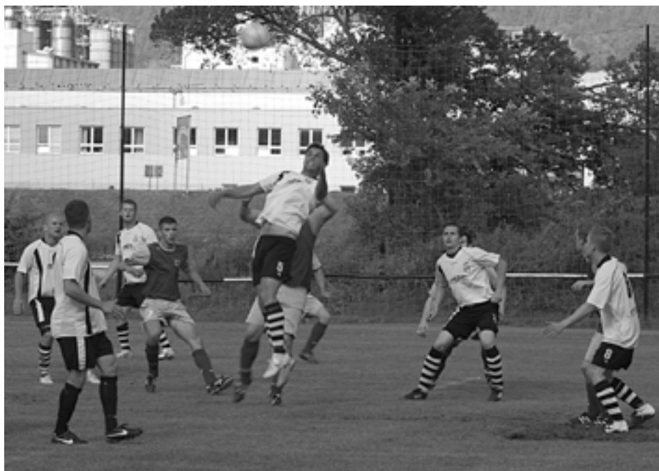
Streženičania nepodľahli tlaku a v poslednom kole oblastnej ligy rozhodli o svojom víťazstve nad Jasenicou už v prvom polčase. Hetrikom sa zaskvel Šprta.

Obom mužstvám už šlo len o prestíž, a tak predviedli divákovi kvalitný útočný futbal. Hostia začali aktívne a už v tretej minúte musel Štrbák