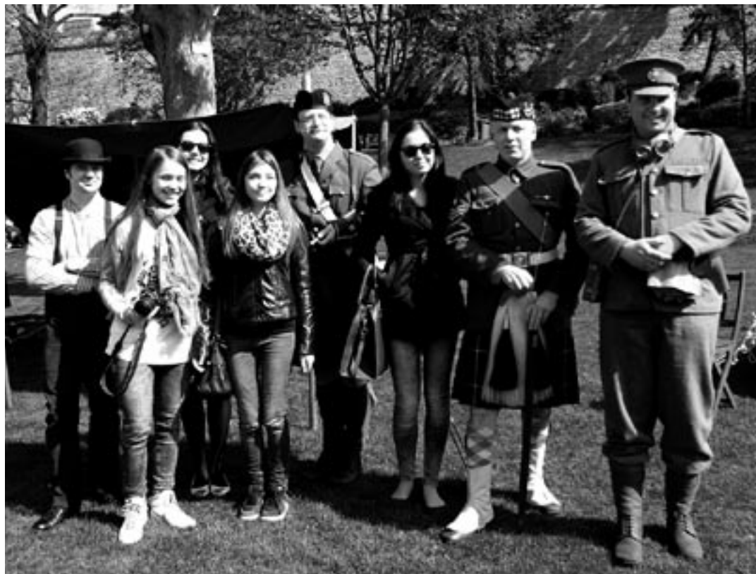
V lincolnskom parku s „účastníkmi“ I. svetovej vojny.