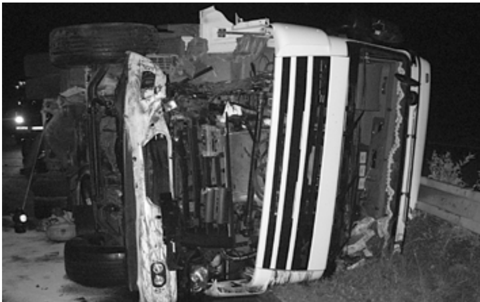
Kamión prevrätý pri privádzači v Beluši na diaľnici D1, blokoval premávku viac ako desať hodín. Nehoda si, našťastie, nevyžiadala vážne zranenie.

Pätnásťeuróvú pokutu musel zaplatiť vodič bieleho BMW s považskobystrickou poznávacou značkou. Krátko pred jednou hodinou ráno stál s automobilom na parkovisku pred OD Lidl a cez otvorené dvere vozidla sa šířila hlasná hudba. Hliadku privolali telefonicky obyvatelia susedných bytových domov, ktorých hudba rušila. Majiteľ automobilu sa dopustil priestupku proti verejnému poriadku.