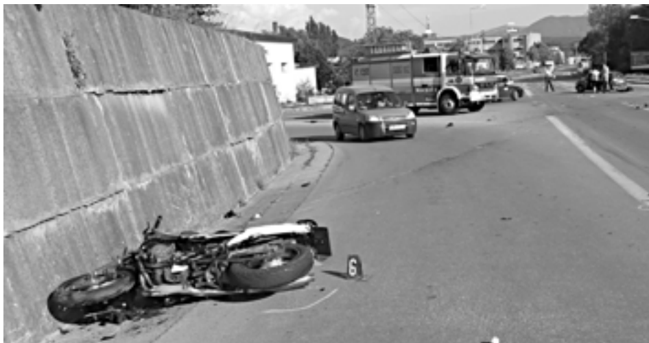
Dopravná nehoda dvoch osobných automobilov a motocykla si vyžiadala dve zranené osoby.