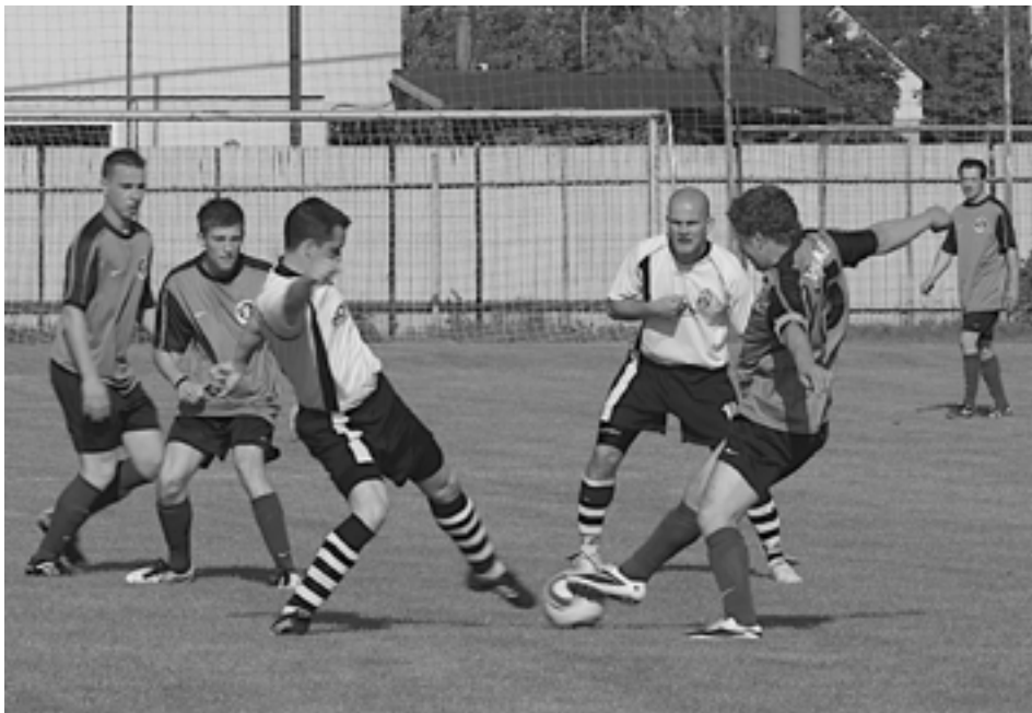
Visolajčania (v tmavom) si v Plevníku urobili poriadnu hanbu. Ešte nedávno jeden z kandidátov na popredné priečky schytil poltucet...

Streženičania sa v závere súťaže zahrávajú