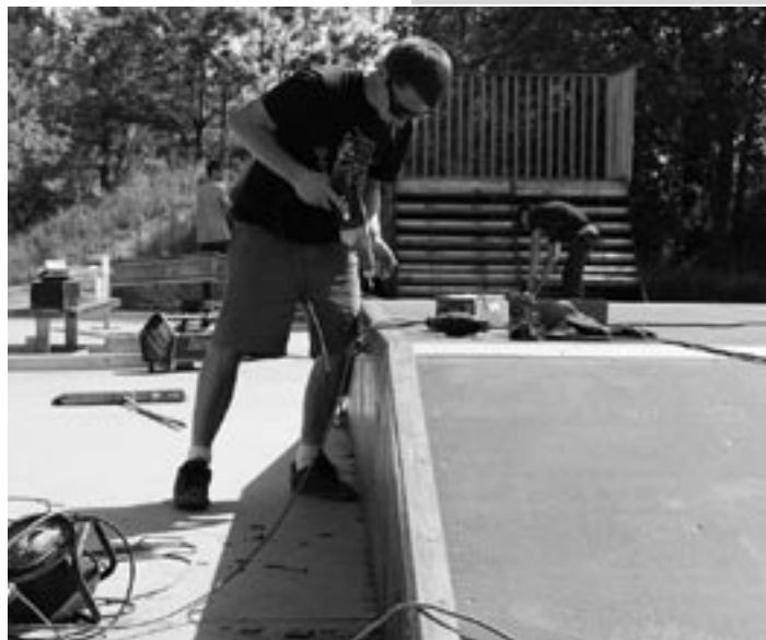
S opravami v skateparku sa dlho neotálalo. Zhruba mesiac po debate na mestskom zastupiteľstve boli poškodené prvky opravené.