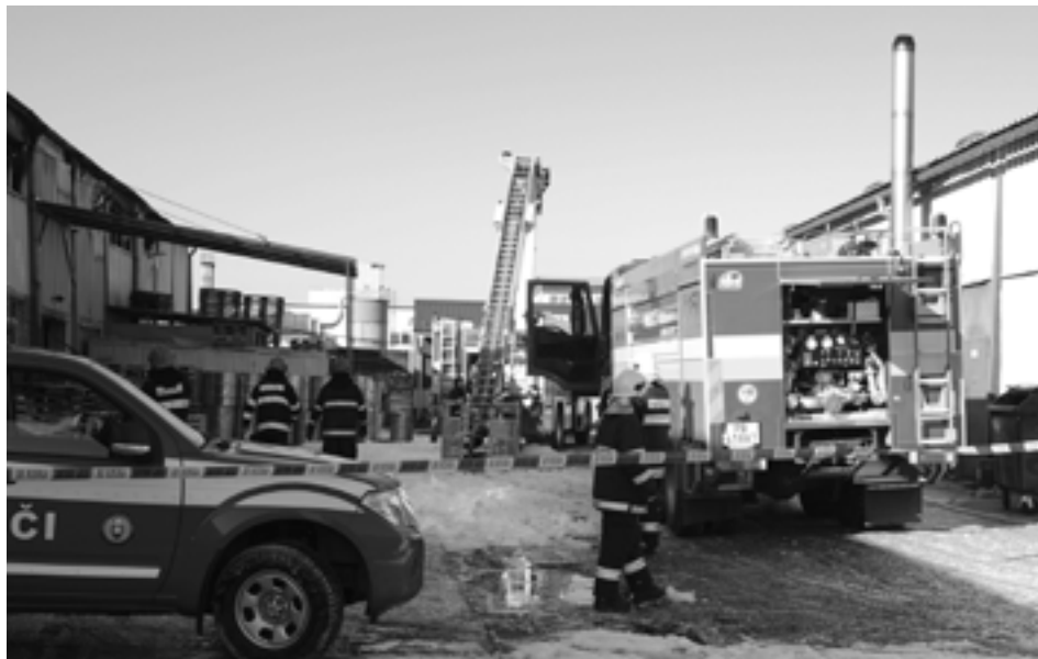
K rozsiahlemu požiaru nebezpečných horľavín privolali v sobotu ráno do Považského Podhradia aj Púchovských hasičov.

Príslušníci mestskej polície riešili na Ulici T. Vansovej oznámenie, podľa ktorého bránili motorové vozidlá vo výjazde pracovným strojom z pozemku Železníc Slovenskej republiky. Po vylustrovaní majiteľov automobilov výjazd sprejzdniť asi po trištvrte hodine, na vozidlá, ktoré bránili vo výjazde, založili blokovacie zariadenia.