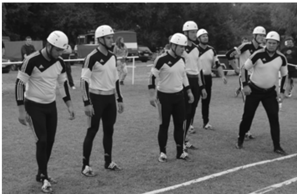
Dobrovoľní hasiči z Podhoria vstúpili do nového ročníka SMHL ako sa na obhajcov patrí - víťazstvom.

Muži: 1. Podhorie (13,59 s) – 20 bodov, 2. Malá Bytča (13,60 s) – 17 bodov, 3. Bobrovček (13,70 s) – 15 bodov, 4. Nosiče (14,05 s) – 13 bodov, 5. Poľný Kesov (14,13 s) – 11 bodov, 6. Brumov B (14,23 s) – 9 bodov, 7. Lednické Rovne (14,49 s) – 8 bodov, 8. Horná Breznica