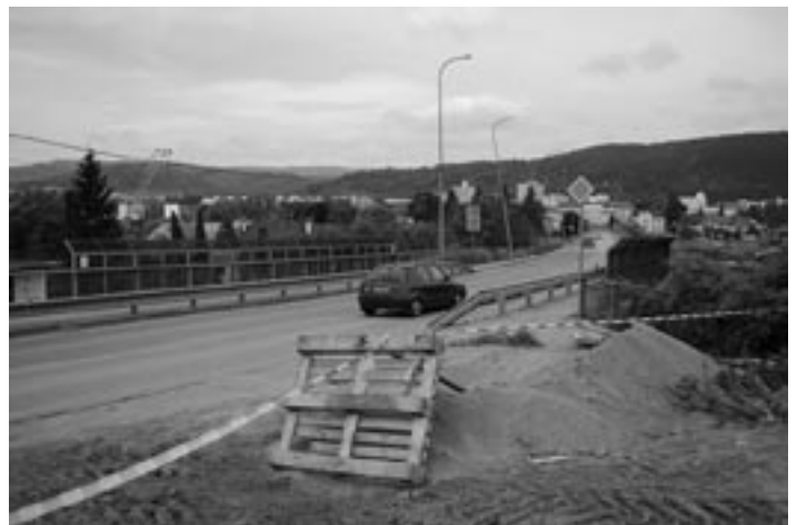
Už iba niekoľko dní bude prejazdny cestný most ponad železničnú trať.

bude vodič informovaný, že most je uzavretý a že neprejde po hlavnej ceste do mesta, ale musí ísť po obchádzkových trasách, ktoré sú vyznačené žltými šípkami. Prvé značenie bude už pri križovatke Beluša – Dolné Kočkovce. Ďalej sú na každej hlavnej križovatke pred Púchovom a v Púchove,“ vysvetľuje Juraj Drocár z oddelenia dopravy a doplnia: „ V meste takisto bude