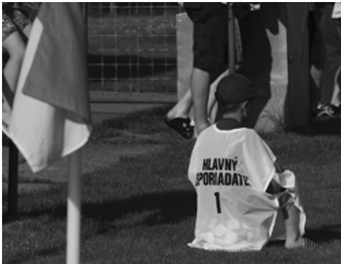
A bude tu poriadok, jasné!