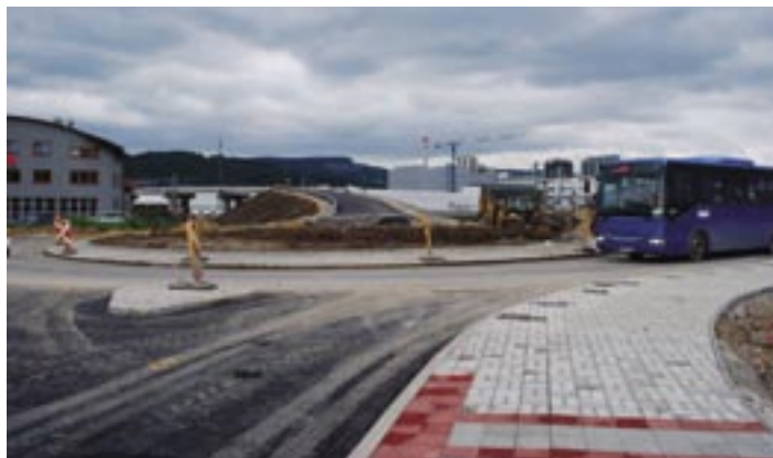
Kruhovú križovatku „Pri lipách“ je stavbou, na ktorej dokončenie sa v súvislosti s uzávierkou mosta čaká.