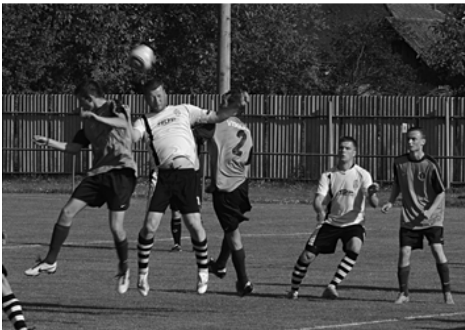
Streženičania (v bledých dresoch) nedokázali využiť výhodu domáceho prostredia a poistiť si náskok na čele súťaže. Podľahli doma Plevníku.

O záchranu bojujúci domáci futbalisti síce začali aktívne, no prvú šancu si vypracovali hostia. Kanonier Mišutka však mieril iba do domáceho brankára. Po štvrthodine mali opäť šancu hostia – Dubaj odcentroval, Mišutkova hlavička však skončila v náručí domáceho brankára Kaniánka. Domáci si mnoho šancí v prvom