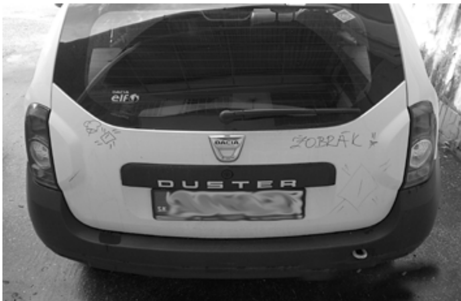
Takéto hanlivé obrázky a nápis nechal na zadnej časti automobilu neznámy páchatel' v Púchove.