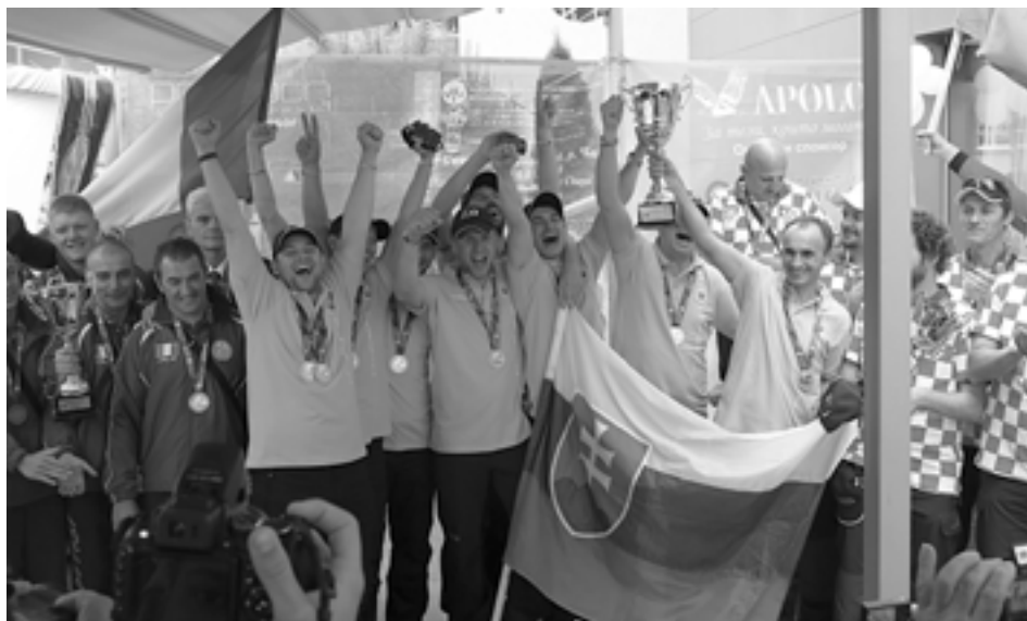
Zlatá slovenská radosť na majstrovstvách sveta v Bulharsku...