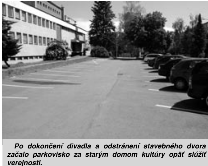
Po dokončení divadla a odstránení stavebného dvora začalo parkovisko za starým domom kultúry opäť slúžiť verejnosti.