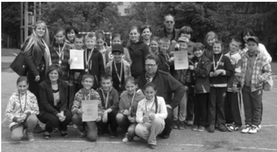
Účastníci okresného finále dopravnej súťaže Na bicykli bezpečne, ktorá sa konala v Lednici.