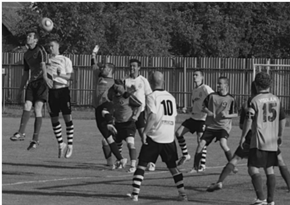
V šlágrí 23. kola oblastnej ligy sa napokon domáci Visolajčania (v tmavších dresoch) s lídrom zo Streženíc o body podelili.

Domáci si už potrebovali napraviť pošramotenú povest' najmä pred domácimi priaznivcami