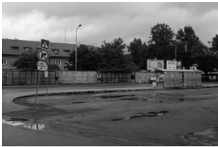
Suma za nájom pozemku pod autobusovým nástupišťom je vyčíslená zhruba na 10 000 eur.