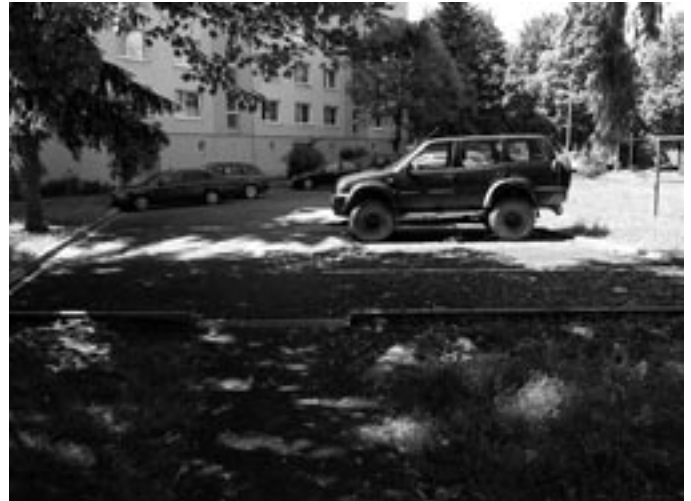
Parkovacie miesta boli vlani doplnené aj na Ulici obrancov mieru.

z tejto ulice zostanú len oči pre plač, opak je pravdou. Obyvatelia Púchova totiž v mnohých prípadoch sami žiadajú o spo-