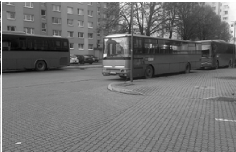
Plochy susediace s autobusovým nástupišťom využívajú vodiči prímestských liniek na parkovanie. SAD Trenčín pre nich nemá zriadenú oficiálnu odstavňú plochu, a tak parkujú, kde sa im zachce - ako ukazuje fotografia - aj na Námestí slobody.

lokalite. O výsledkoch bude laická i odborná verejnosť včas informovaná.