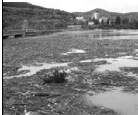
Priehradu zaplavili tony odpadu...