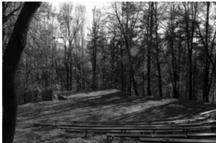
Amfiteáter je už niekoľko rokov nevhodný na usporadúvanie kultúrnych podujatí.

ktorý zvyčajne na takýchto plochách býva postavený. „Pódium by sa malo o niečo zväčšiť, aby sa naň tanečníci komfortne zmestili. Zároveň však projektanti museli rešpektovať danosti svahovitého terénu, ktorý by pri väčšej rekon-