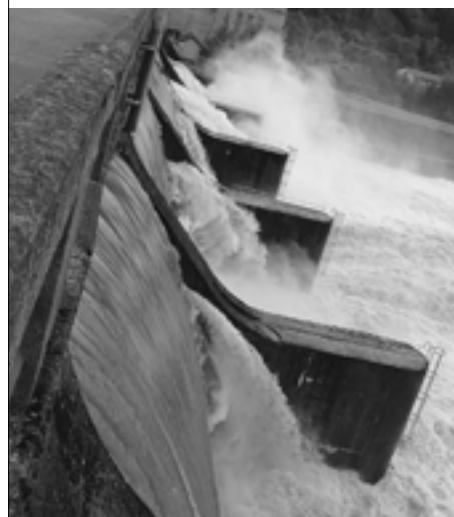
Vodohospodári museli prepúšťať vodu aj hornými klapkami.