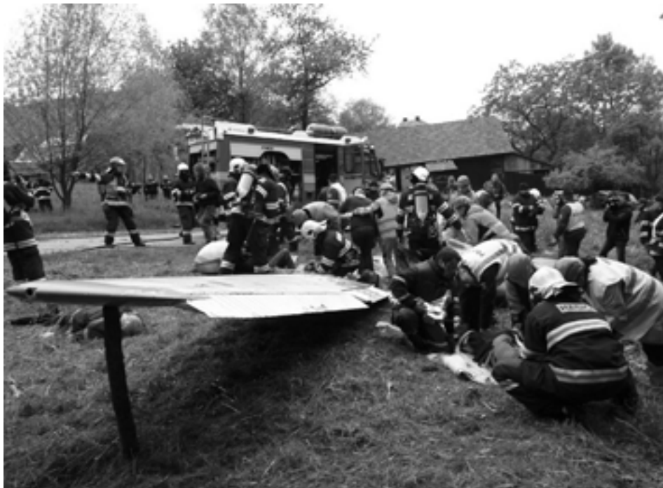
Simulovaná zrážka lietadiel v horskom prostredí preverila schopnosti záchranných zložiek na českej i slovenskej strane hranice.