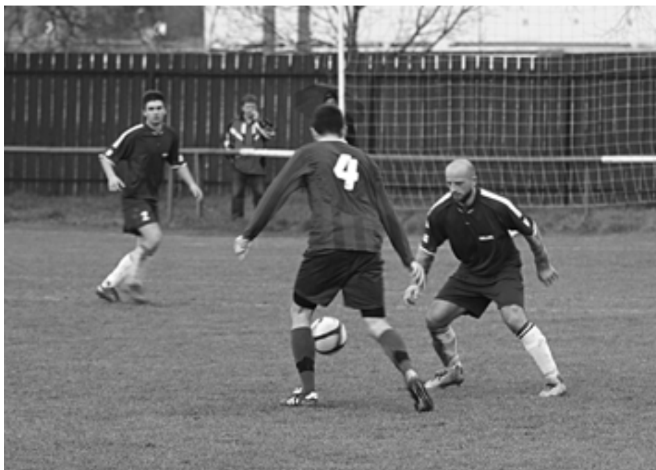
Dolné Kočkovce (v bielych štulpniach) nezvládli ďalší zápas na domácom trávniku a opäť stratili všetky body. Kočkovania klesli už na tretie miesto od dna tabuľky.

V priamom stretnutí o druhú priečku tabuľky hostia totálne vyhoreli a pokračujú v nepresvedčivých výkonoch. I napriek tomu sa ujali vedenia už v ôsmej minúte, kedy otvoril skóre Baránek – 0:1. Domáci vyrovnali už o tri minúty zásluhou Tótha – 1:1 a v 35. minúte poslal Papradno do vedenia gólom z priameho kopu S. Trúchlik – 2:1. V druhom polčase už po troch minútach zvýšil Galko po Brezničanovej strele na 3:1, hostia ešte kontrovali gólom Palmeho z pokutového kopu, no to bolo z ich strany všetko. Na 4:2 zvyšoval v 65. minúte Fujaček a po vylúčení hosťujúceho P. Kresánka zvýšil Galko po úniku na 5:2. Päť minút pred koncom si Galko položil brankára a zvýšil na