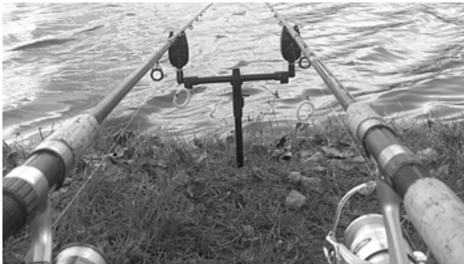
Takmer jarné počasie využíva na rybačku mnoho rybárov aj v januári...