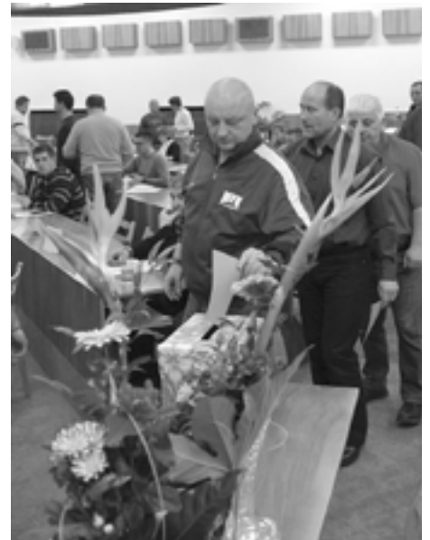
Delegáti konferencie si volili zástupcov na ďalšie štyri roky.