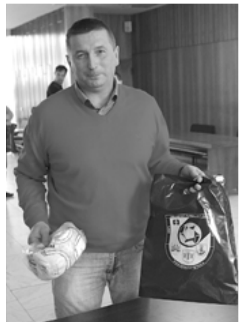
Jedným z pozitívnych momentov konferencie bolo odovzďavanie lôpt pre mládež. Prebral si ju aj zástupca Lednických Rovní.