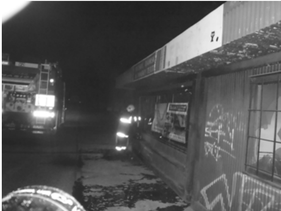
Archívnu fotografiu púchovských hasičov sa vraciame k nedávnomu požiaru unimobunky na Okružnej ulici v Púchove. Po hektickom úvodnom tohtoročnom týždni si v tom minulom prislúšníci Hasičského a záchranného zboru z Hasičskej stanice v Púchove aspoň trochu oddýchli, nemuseli zasahovať ani raz.

Mercedes s považskobystrickou poznávacou značkou našla hliadka predpoludním stáť v kruhovom objazde pri parkovisku na Hollého ulici. Vozidlo nebolo označené výstražným trojuholníkom, bez posádky a nebolo možné zistiť, či má nejakú poruchu, prípadne dopravnú nehodu. Prípád nahlásili mestskí policajti svojim kolegom z Obvodného oddelenia Policajného zboru v Púchove, ktorí sa prípadom zaoberajú.