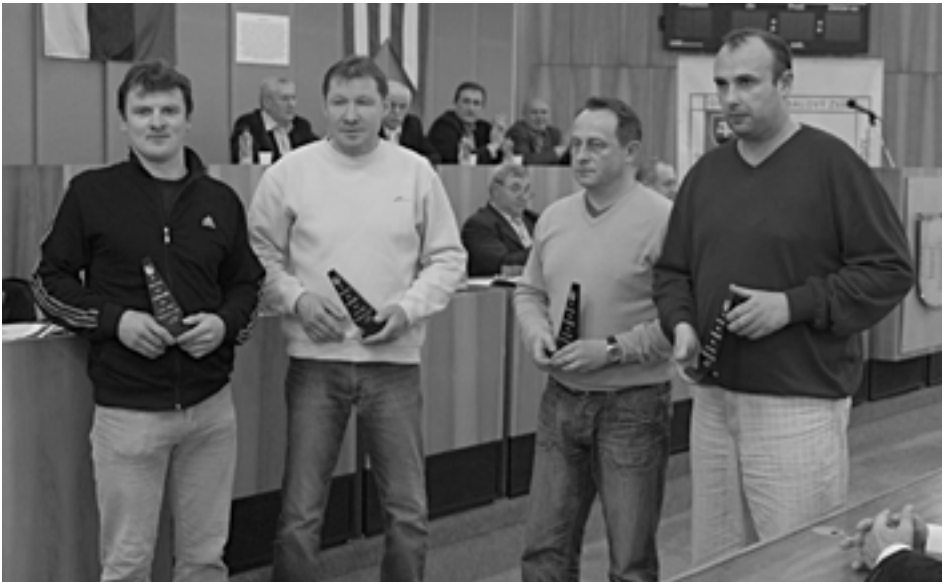
Štyria z piatich odemených zástupcov klubov, ktorých ObFZ ocenil za prácu s mládežou. Piatym mal byť predstaviteľ futbalového oddielu zo Streženíc. Na volebnú konferenciu však neprišiel zo Streženíc nikto...