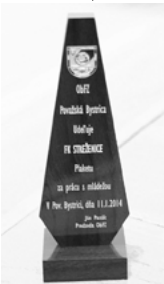
Trofej za prácu s mládežou zostala osirotená na stole...