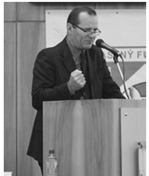
Plamenný prejav predsedu ZsFZ. Nechýbala ani údernícky zaťatá päšť...