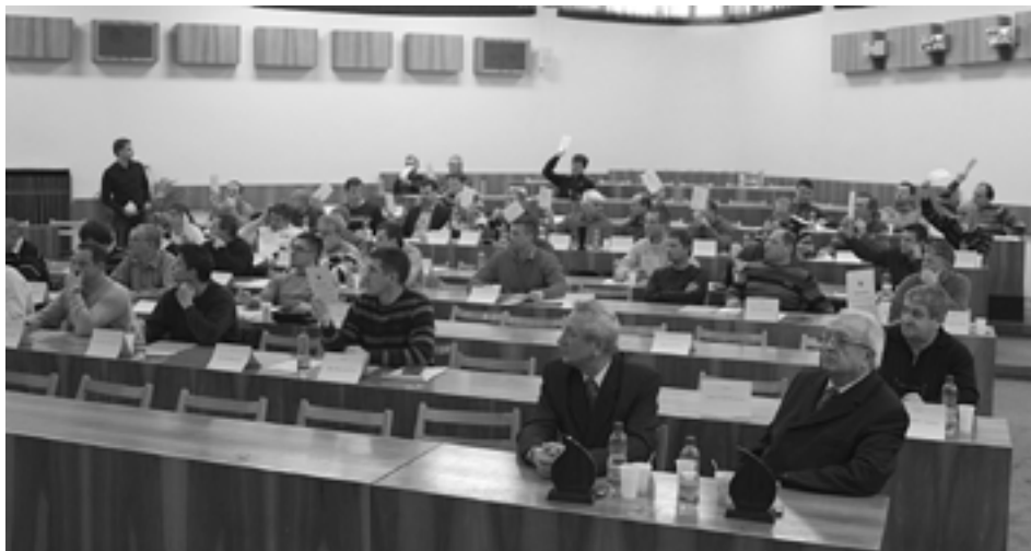
Konferencia ObFZ v Považskej Bystrici potvrdila nezáujem väčšiny klubov z okresu Púchov o dianie v oblastnom futbale.

Konkrétnejší charakter nabrala konferencia počas správy o hospodárení za minulý rok. Podľa jej predkladateľa Vladimíra Svitka, ObFZ v minulom roku skresal plánovaný deficit o takmer 500 eur na 2540 eur. Mohol byť podľa neho aj oveľa nižší, zväz sa však rozhodol kúpiť za 2000 eur nové futbalové lopty pre kluby a