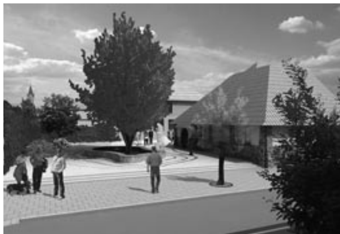
Štúdia nového námestia pri Základnej umeleckej škole.