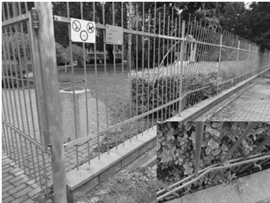
Plot na mestskom parku poškodil minulý týždeň neznámy „polovodič“...

Pravidlá statickej dopravy – nesprávne parkovanie, riešia príslušníci púchovskej mestskej polície takmer denne. Aj v minulom týždni zistili viac ako desať prípadov porušenia všeobecne záväzného nariadenia mesta, vo väčšine prípadov obišli vodiči s dvadsaťeuróvou pokutou.