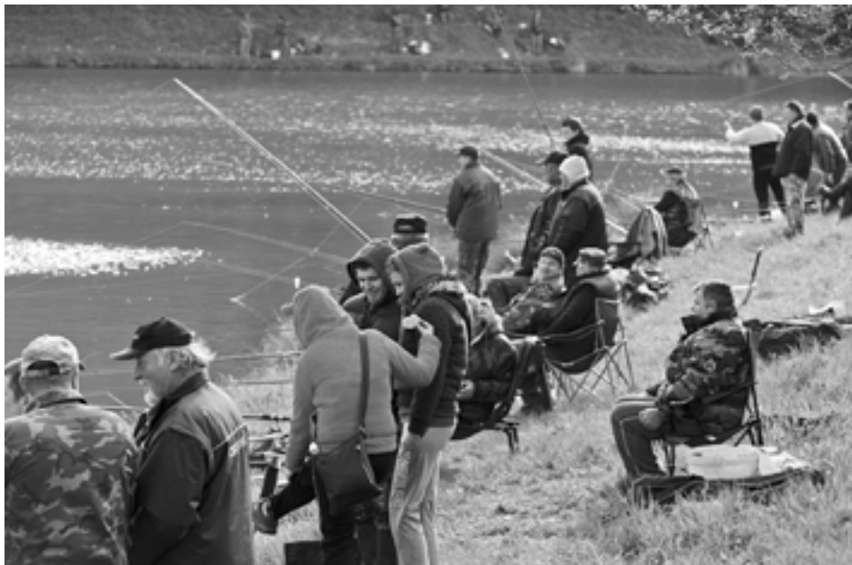
Ani chladné počasie neodradilo takmer tri stovky vyznavačov Petrovho cechu od účasti na jarných rybárskych pretekoch na vodných nádržiach Ihrište.