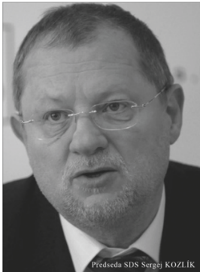
Predseda SDS Sergej KOZLÍK