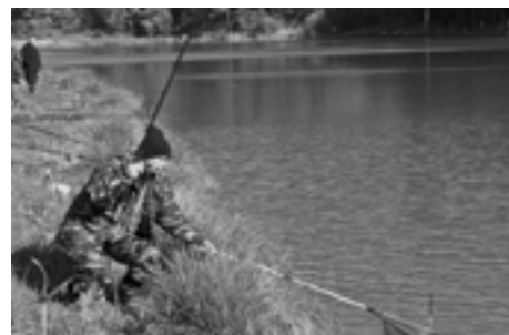
A je tam...