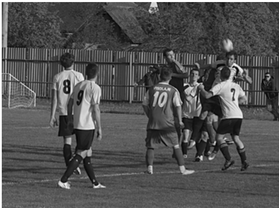
V okresnom derby sa minulý týždeň Visolaje s Lysou pod Makytou o body podelili. V nedeľu obaja prehrali, navyše Lysá (v bledom) na domácom trávniku.

V súboji o druhé miesto v tabuľke sa striedalo ako pre Verdune. Presnejšiu mušku mali tentokrát domáci, a tak vystriedali Visolaje na druhej priečke tabuľky. Maloledničania šli do vedenia v ôsmej minúte, kedy hosťujúceho