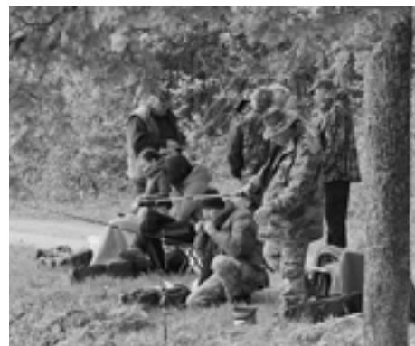
Príprava na lov je dôležitá