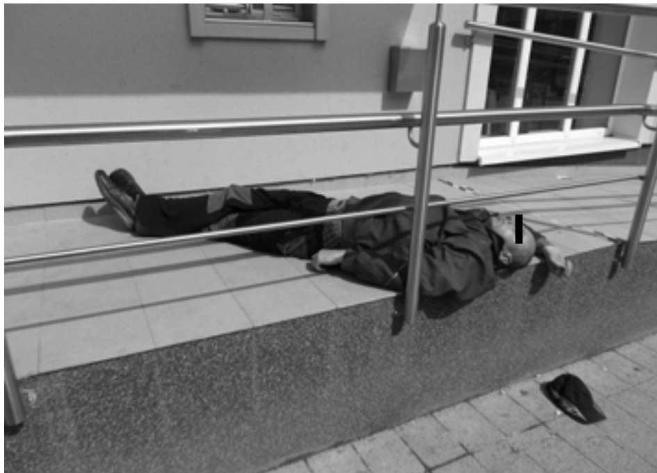
Priamo pod bankomat na Štefánikovej ulici si „ustlal“ muž z Hoštinej.

Hliadka MsP našla popoludní ležať na Štefánikovej ulici pred bankomatom opitého muža z Hoštinej. Priestupok fotograficky zdokumentovali a muža odviezli do miesta trvalého bydliska. Priestupok je v riešení.