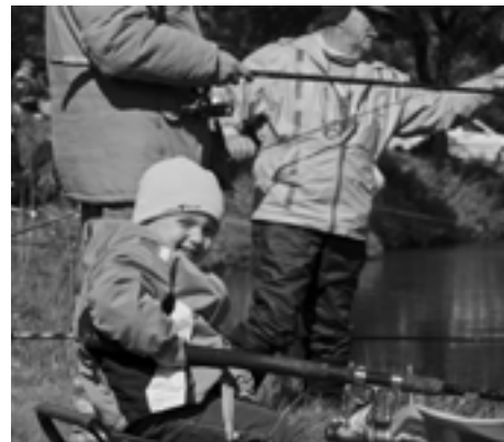
Čo sa za mlada naučíš... Na pretekoch v Ihrišti nechýbal ani rybársky „poter“