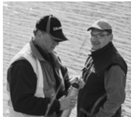
V chladnom počasí aj rybárom padol vhod dúšok horúceho čaju...