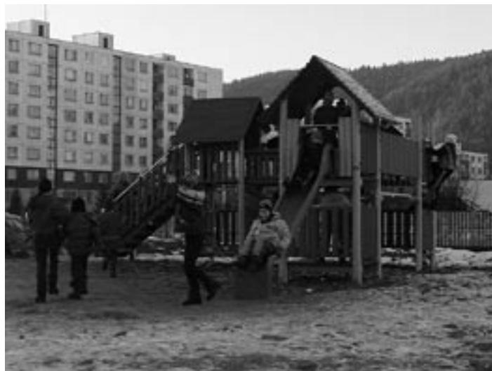
Záber z decembra 2001. Nedočkavé deti testujú nové detské ihrisko medzi Moravskou ulicou a Námestím slobody. Až o päť rokov neskôr bola v jeho blízkosti zriadená Marczibányiho záhrada.