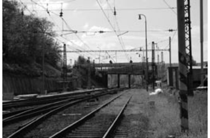
V priebehu júna by sa malo zbúrať premostenie železnice v smere na Žilinu.

byť dokončené do konca mája tak, aby do júna vznikla táto lávka. Bude upravená, aby sa po nej dalo bezpečne chodiť, pri-