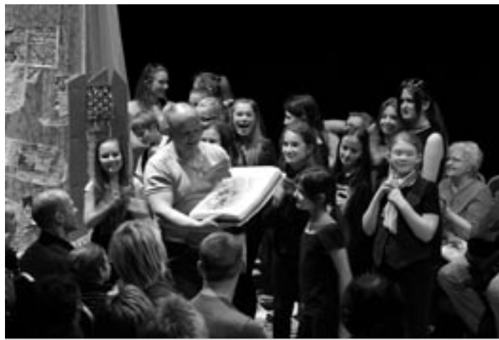
Po úspešnej premiére čakala na mladých divadelníkov tradičná torta.

Láka ho aj téma, o ktorej jav sám veľa nevie – Rómovia, ich svet, rozprávky, poetika. „ Pri znám sa, že sám mám voči nim nejaké predpojatosti. Mám zlé skúsenosti a naopak - aj veľmi dobré. Už som medzi deťmi robil prieskum a zisťoval, čo o nich vedia. Nevedia o nich nič, ale v zásade si myslia, že sú zlí. Tak som si povedal, že je zrejme najvyšší čas začať o tejto téme hovoriť. Nebudem ich presviedčať, že sú dobrí – chcem im len ukázať, odkiaľ vychádza ich kultúra, otvoriť im svet, ktorý je možno zaujímavý. Aby mali informácie z oboch strán a mohli si utvoriť vlastný názor, na ktorý budú mať aj argumenty. Lebo zatiaľ všetko, o čom sú presvedčení, počuli len doma, prípadne v televízii... “