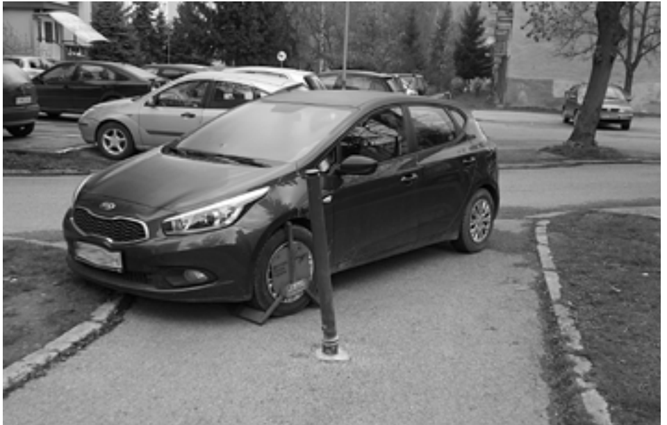
Niektorí vodiči si v Púchove vysvetľujú VZN o parkovaní po svojom...

Rušenie nočného pokoja riešila hliadka MsP na Moravskej ulici krátko pred polnocou. Na oddelenie mestskej polície predviedli dve mladistvé dievčiny a štyroch mladistvých chlapcov, ktorí rušili nočný pokoj hulákaním. U piatich zo šiestich narušiteľov verejného poriadku zistili orientačnou dychovou skúškou prítomnosť alkoholu. Jeden z mladistvých sa zároveň dopustil priestupku tým, že umožnil požitie alkoholu (domáceho destilátu) ostatným rovesníkom. Zaplatil pokutu vo výške 15 eur. Všetci mladiství, ktorých predviedli na oddelenie mestskej polície, boli žiakmi Základnej školy Mládežnícka v Púchove.