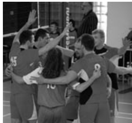
Púchovskí volejbalisti mali len veľmi málo príležitostí na takéto radostné okamihy.