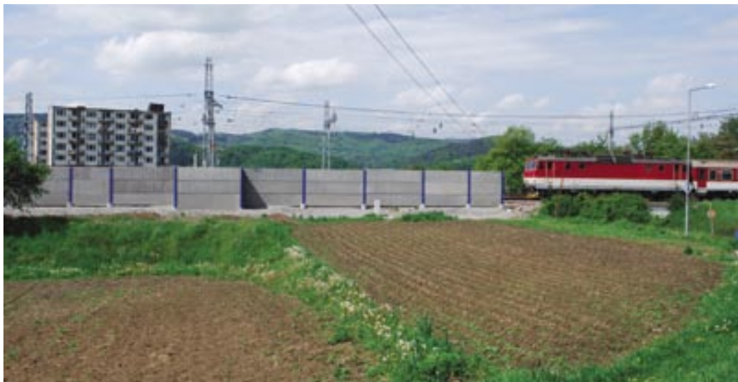
Hornokočkovaniam budú môcť obyvatelia Kolonky ich protihlukové steny asi iba závidieť.