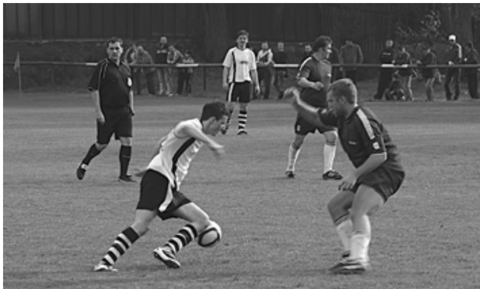
Okresné derby zvládli pred dvomi týždňami Streženice (v bledom) v Dolných Kočkovciach na výbornú. Uplynulá nedela im v ďalšom derby v Lysej šťastie neprinesla, líder prehral rozdielom triedy.