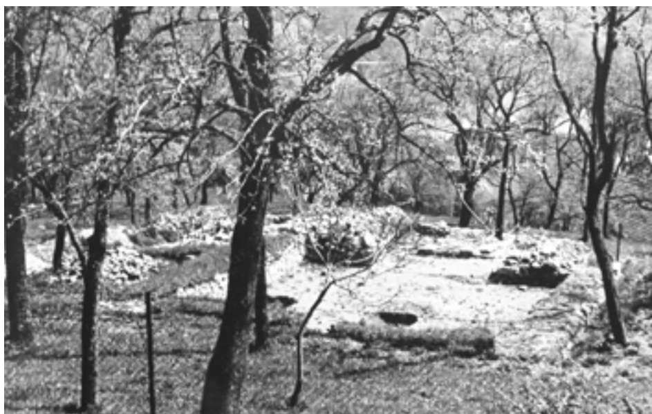
Archívna snímka obce Lednica z roku 1966, kedy zaniknutý kostol objavili a vykopali.