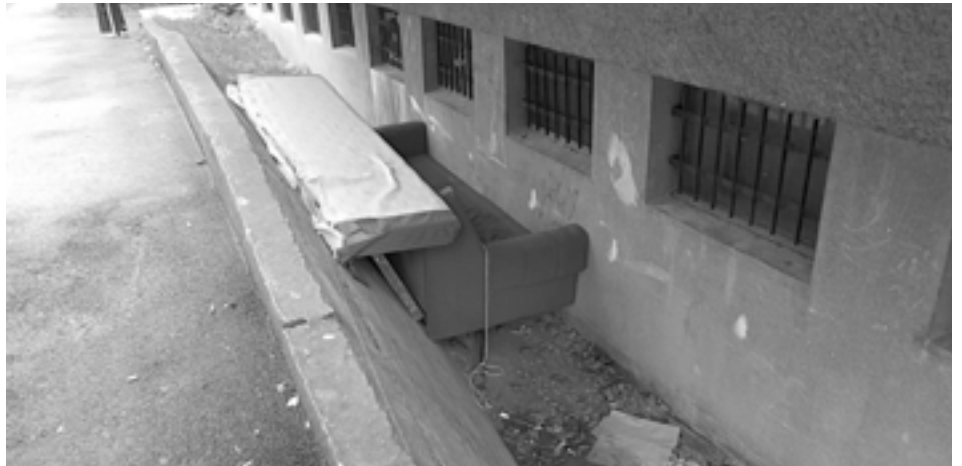
Vynaliezavosť bezdomovcov v Púchove nemá hraníc. Taktom si upravili bývanie v jednej z lokalít Púchova.