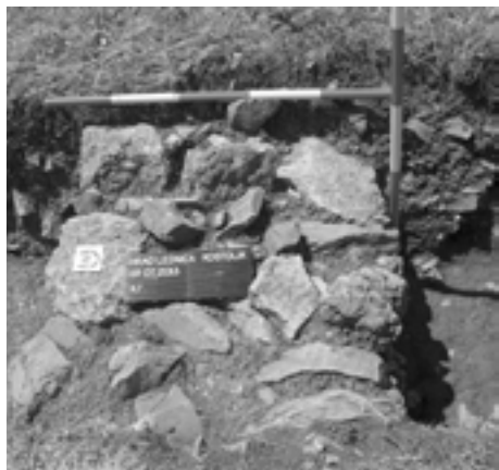
Múr citorína na mieste bývalého kostola objavili v minulom roku.

„Na zaniknutom kostole sme v roku 2013 realizovali sondážny archeologický výskum a architektonicko – historický výskum. Rozmiestnenie sond malo overiť súvislosti medzi murivami, nájdanie nivelety základu, zistiť