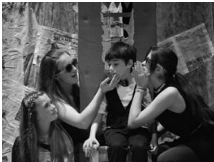
DDŠ Ochotníček sa predstavil s hrou Nigra sur blanka.