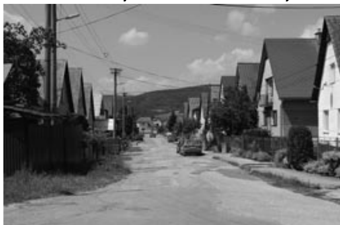
Po rekonštrukcii Továrenskej ulice príde rad aj na kompletnú opravu Lichardovej ulice.

„ Blokujeme ich, pretože sme sa rozhodli, že im nedáme súhlas na výluku, kým nebudeme mať zrekonštruovanú Továrenskú ulicu, a to z toho dôvodu, aby nedochádzalo k ničeniu toho, čo ešte nie je postavené, “ povedal primátor. Dôvodom takejto podmienky sú nesplnené termíny zo strany realizátora všetkých rekonštrukcií, ktoré súvisia s prestavbou železníc. Spomínaná firma totiž konkrétne s uzatvorením mosta mešká už takmer rok. Podľa pôvodných plánov chcelo mesto začať najskôr so stavebnými prácami na Lichardovej ulici, keď sa ale ukázalo tak veľké meškanie, rozhodli sa obrátiť gardé a stihnúť najskôr dôležitejšiu - Továrenskú ulicu. „ Tlačíme na realizátora stavby Továrenskej ulice, aby to stihli do konca mája. V tom poslednom období budeme čakať už len na dodávateľa teplých zmesí. Keď spustia produkciu, v tom momente ju začneme navádzať. Číže koncom mája až v polovici júna by malo byť všetko hotové. “ Továrenská zostane priechodná a bude slúžiť na obchádzkové trasy. Uzatvorí sa však úsek Trenčianskej ulice a až na záver po vybudovaní cestného nadjazdu sa dorobí posledná časť Továrenskej ulice, resp. križovatka medzi Továrenskou a Trenčianskou ulicou, ktorú má v rézii OHL ŽS. „ Pri zbúraní zhlavia, tam bude iba lávka pre peších, ktorá bude slúžiť jeden rok. A oprava povedie cez privádzač na autobusové nástupište, kde sa autobusy budú otáčať a znova pôjdu po