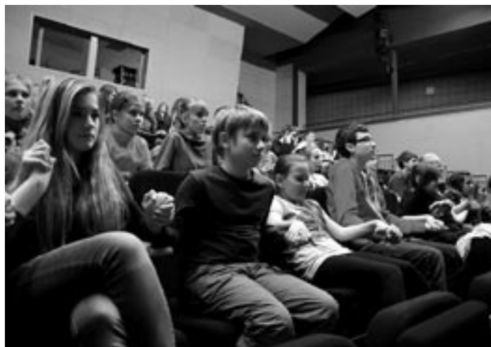
DDŠ Ochotníček pred vyhlasovaním výsledkov.