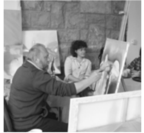
Jarné sympóziu prinieslo pre výtvarných umelcov mnoho inšpirácií.

Možno len s obdivom oceniť organizátorov tejto akcie, pretože sa podarilo pritiahnúť záujem veľa mladých ľudí, o čom svedčí okolo 100 účastníkov vernisáže prevažne strednej a mladej generácie. Ako obvyčajne, nepodarilo sa pritiahnúť záujem zástupcov kultúry v Púchove a Považskej Bystrici. Jedinú možnosť spoznať talent mladých umelcov by im určite pomohla v budúcnosti pri realizácii výstav organizovaných v týchto mestách. (r)