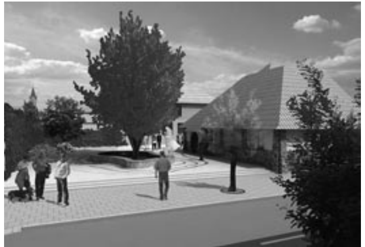
Už zo štúdie je zrejmé, že z okolia základnej umeleckej školy bude odstránené oplotenie a priestor sa tak otvorí verejnosti.

Priestor medzi budovou bývalej pošty a historickou budovou ZUŠ-ky, ktorý je toho času prázdny,