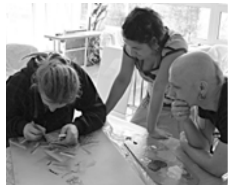
Sympóziu svoj účel - ukázať a naučiť sa, splnilo.