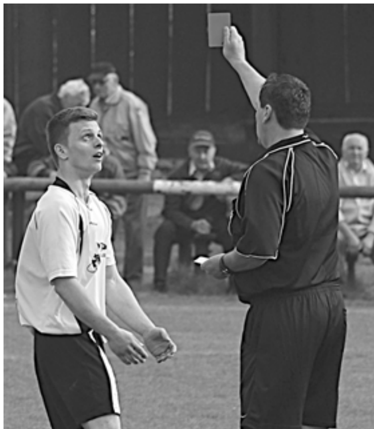
Trdičný pohľad previnilcov po udelení červenej karty. Ja nič, ja muzikant...

V bode B. NAPOMÍNANÍ A VYLÚČENÍ HRÁČI netreba pri udelení OT ŽK uvádzať dôvod udelenia OT. Ten sa uvádza len pri 2. ŽK s následnou ČK. Pri udelení ČK bez predošlej ŽK, treba priestupok za ktorý bola ČK udelená podrobne popísať.