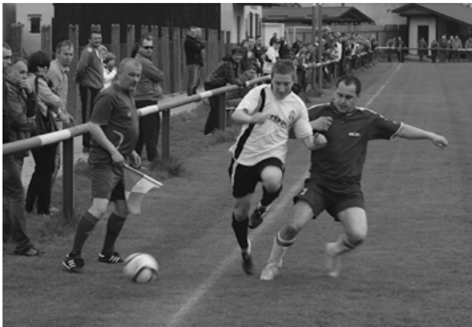
Futbalisti Dolných Kočkoviec nastúpili po minulotýždňovom domácim derby na ďalšie. Tentokrát na trávniku vo Visolajoch obišli rovnako naprázdno, ako doma.

Hostia neprišli k lídrovi s veľkými očami, naopak, nedokázalo sa ich nazbierať ani plný