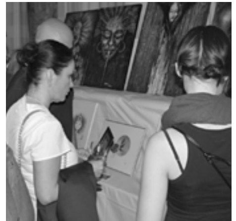
Ucelený prehľad výtvarných diel vytvorených počas celého týždňa priniesla vernisáž na záver sympózia.