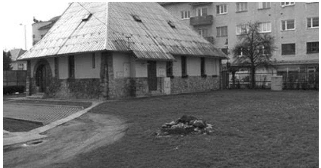
Aktuálny stav vnútorného areálu Základnej umeleckej školy v Púchove.

tak nadobudne ráz námestia či malého parčíku. Okrem drobnej architektúry, lavičiek, smetných košov a zelene, pribudne osvieženie v podobe symboliky mesta. „ Prázdny priestor bude vyplnený dlažbou, v ktorej by mala byť zabudovaná štylizovaná mapa mesta. Strom so studňou, ktoré tam sú, by mali tvoriť bod, na ktorom sa práve nachádzate. Takže keď si tam prídete oddýchnuť, budete si v dlažbe môcť pozrieť, kde práve ste a ako je mesto formované. “ Plánovaná rekonštrukcia sa samozrejme dotkne aj cesty a príľahlých chodníkov. „ Komunikácia sa upraví asfaltovým povrchom a chodníky sa vydláždia