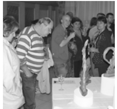
Diela umelcov z troch krajín zaujali profesionálov i laikov.