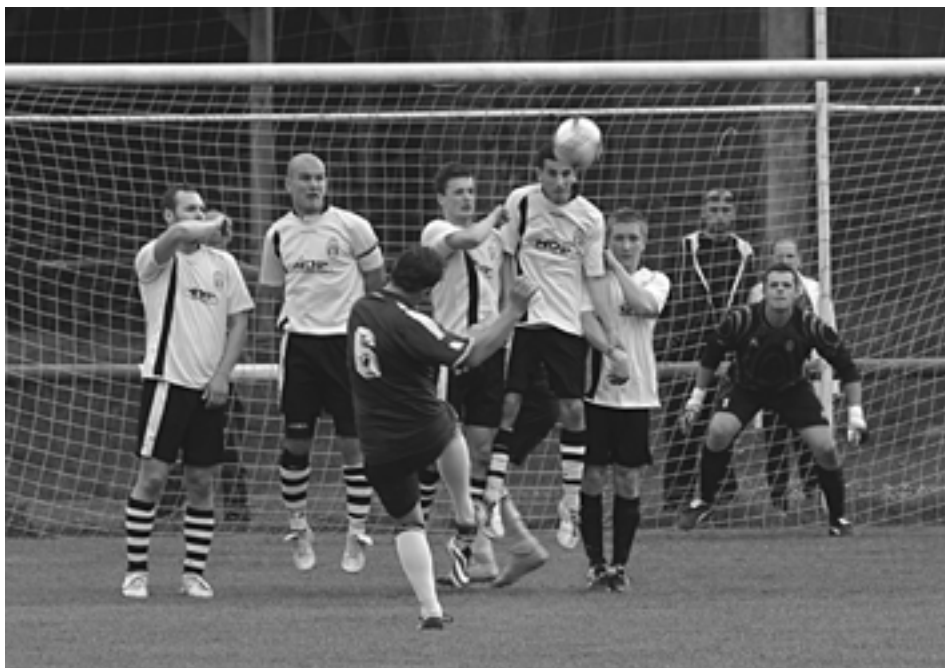
V záverečnej desaťminútovke kopali Dolné Kočkovce sériu priamych kopov. V tomto prípade sa síce domácemu Rosinovi (s číslom 6) podarilo prekpnúť streženický múr, no lopta skončila na brvne. Dolné Kočkovce tak podľahli Streženiciam 1:2.

Brvnišťania sú na jar vo forme a potom, ako si odviezli všetky tri body zo Streženíc, deklasovali tentokrát ďalšieho lídra z Visolaj. Domáci išli do vedenia už v úvodnej minúte, keď J.