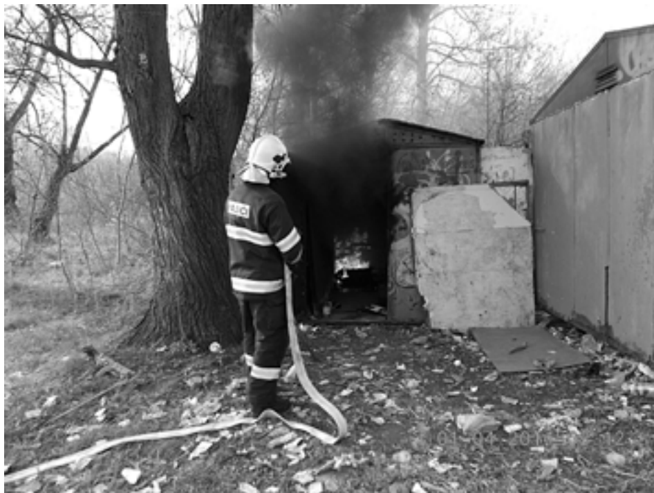
S požiarom plechovej budy pri Váhu si púchovskí hasiči bez problémov poradili.