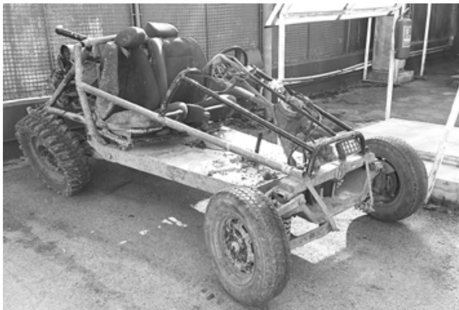
Jazda na podomácky vyrobenom vozidle sa stala osudnou v Zubáku dvojici mužov. Po havárii skončili obaja v nemocnici. Obom navyše namerali viac ako jedno promile alkoholu.

Krátko po polnoci 2. apríla vykázala hliadka mestskej polície dvoch bezdomovcov, ktorí posedávali na tržnici za predajnými stánkami.