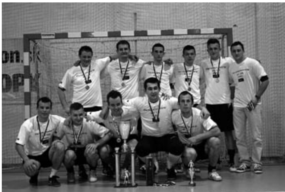
JAMAICA PRENOSIL - víťaz mestskej futsalovej ligy v sezóne 2013/2014.