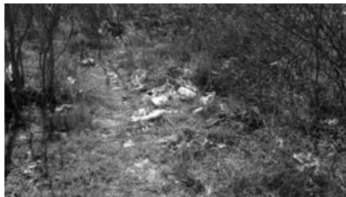
Náš čitateľ Ján Druska nám poslal aktuálne fotografie z pravého brehu Váhu. Množstvo odpadu, v ktorom dominujú plastové fľaše.