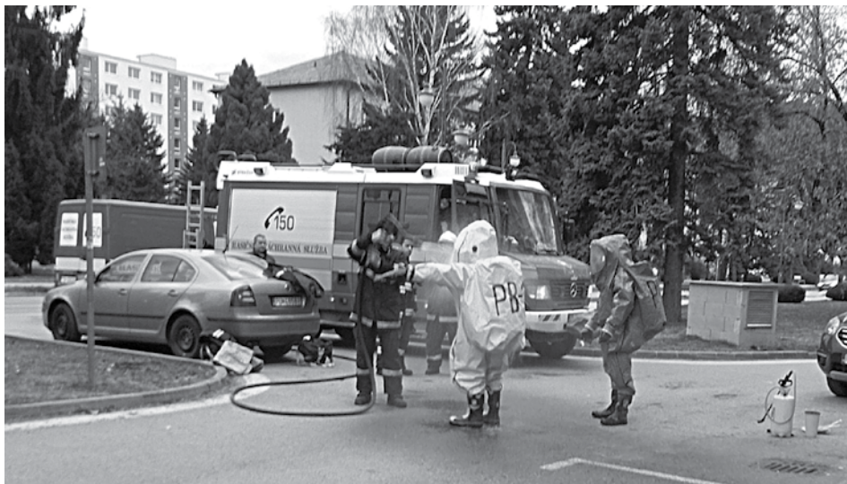
Na Štefánikovej ulici zasahovali hasiči po doručení podozrivej obálky v špeciálnych oblekoch...