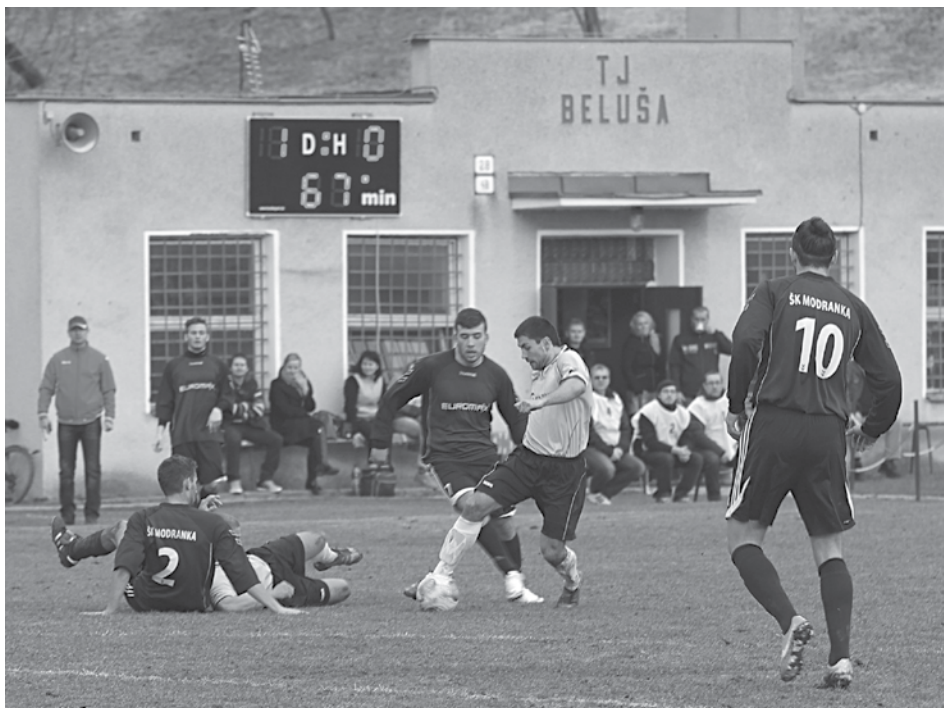
Líder štvrtej ligy z Beluše (v bledých dresoch) na domácom trávniku potvrdil úlohu favorita a hladko porazil Modranku. Po remízovom zaváhaní druhých Bánoviec tak majú Belušania v čele trojbodový náskok.