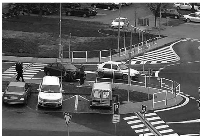
Nepozorný vodič „zrámoval“ zábradlie na novom kruhovom objazde pri Zdraví.

nebol veľký, strom sa podarilo zvaliť relatívne ľahko. V tomto prípade bola škoda minimálna, keďže strom bol už skutočne na