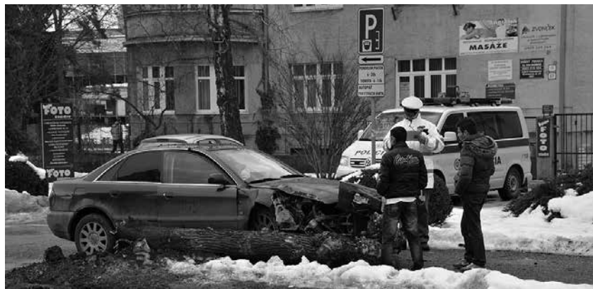
Po nehode na Štefánikovej ulici zostali nielen poriadne pokrčené plechy, ale na zemi aj vyvrátená sofora japonská.