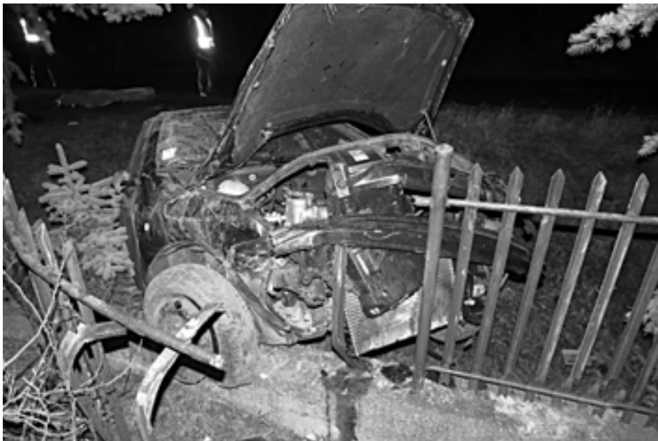
Kým počas celého roku 2013 nezomrel na cestách Púchovského okresu ani jeden človek, v novom roku vyhasol mladý život hneď v prvý deň. Pri nehode v Zárieči vyhasol život 17-ročného mladíka.

Donucovacie prostriedky musela použiť hliadka MsP hneď dvakrát v priebehu štvrtých hodiny 29. decembra nadržanom. V prvom prípade predviedli na oddelenie Púchovčana, ktorý neuposlúchol výzvu polície na Ulici 1. mája. Za rušenie nočného pokoja predviedla hliadka za použitia donucovacích prostriedkov za účelom zistenia totožnosti muža z Dohnian, ktorý rušil nočný pokoj na Ulici F. Urbánka. V oboch prípadoch sú priestupky v riešení.