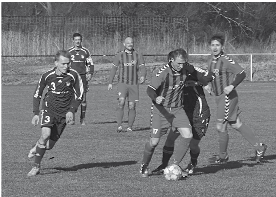
Horovčania (v pruhovaných dresoch) podali na úvod jarnej časti piatej ligy vlašný výkon a prehrali s Trenčianskou Turnou.