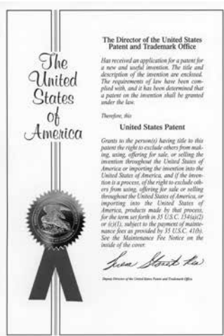
Americký patent pre firmu Logitex.

som kontaktoval výrobcov bojlerov v Poprade a vysvetlil som im, o čo ide. Niekoľkokrát som im napísal, boli aj nejaké odpovede, ale po troch mesiacoch čakania a mojich urgenciách mi oznámili, že o takéto riešenie nemajú záujem. Vôbec nevidia perspektívu v tom, čo som vymyslel. Keď som to isté ponúkol českému výrobcovi, ten do 48 hodín prišiel k mne a okamžite mi predostrel zmluvu o spolupráci. To je rozdiel medzi vnímaním obchodu českej a slovenskej firmy. Česi sú rodení obchodníci, majú cit pre obchod. Slováci - podnikatelia sa musia asi presvedčiť na iných troch a výrobkoch, že ten slovenský výrobok je naozaj výborný a pracuje super. Bohužiaľ, výrazná vlastnosť Slovákov je zavisť. Naozaj dnes na rôznych fórach, napríklad tomu, že vyrábame skvelý výrobok, ktorý bol ocenený na výstavách (v Srbsku, v Bosne a Hercegovine – kde získal zlatú medailu ako najpokročejší výrobok v rámci obnoviteľných zdrojov), čítam veľmi negatívne komentáre. Nie na kvalitu, tú nemajú šancu posudzovať, lebo je výborná, ale na podstatu ako takú. Medzi riadkami tam tá zavisť je.