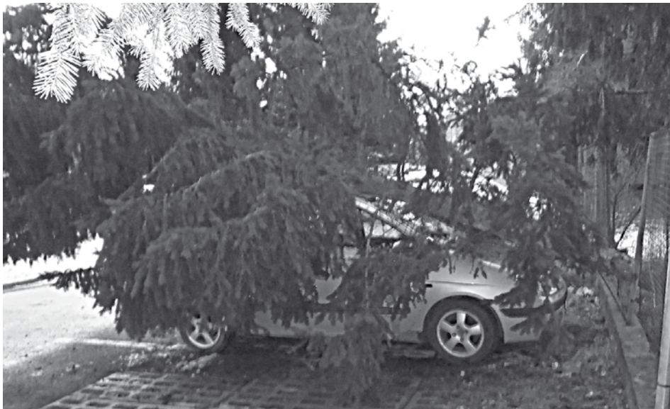
Nepríjemné prekvapenie čakalo majiteľa osobného automobilu na Komenského ulici v Púchove. V utorok ráno mu naň padol vyvrátený strom.

Z celkového počtu ochorení bolo 1349 ochorení na chrípku, v porovnaní s predchádzajúcim týždňom chorobnosť klesla o 38,11 percenta. Chrípka najviac trápila deti od šesť do 14 rokov. Pre chrípku museli v kraji prerušiť školskú dochádzku v troch materských a troch základných školách, ani jedna z nich nebola v Púchovskom okrese. (r)