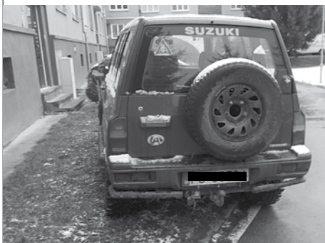
Aj takto sa parkuje v Púchove...

Hliadka mestskej polície začula počas kontroly ulíc volanie o pomoc a dupot za jednou z kaviarní na Royovej ulici. Policajti prekontrolovali vnútroblok a našli tam opitého Púchovčana. Sedel na zemi a mal drobné poranenie na tvári. Hliadku informoval, že sa mu nič nestalo, odmietol ošetrovanie a nechcel nič oznamovať.