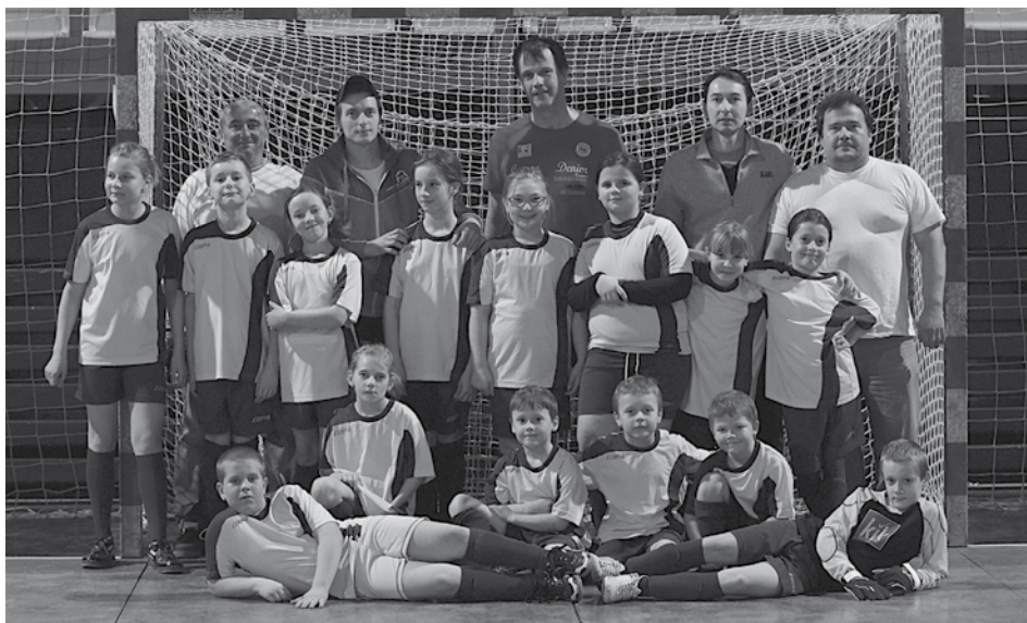
Prípravka Fan Clubu Púchov sa v Považskej Bystrici ani raz netešila z víťazstva, no ich herný prejav a entuziazmus družstva, v ktorom bolo niekoľko dievčat, zaujal.

Udiča – Sverepec 3:0 , Harbas, Britvík, Žboudka, Lednica – Beluša 0:1 , Zbiň, Přešov – Ilava 7:0 , Skalský 5, Ďaptúch 2, Sverepec – Lednica 0:3 , Hochla 3, Ilava – Udiča 0:0 , Beluša – Přešov 0:5 , Matula, Caletka, Dvor-