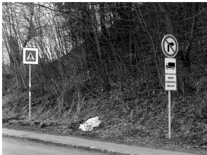
Už pred odbočkou do Nových Nosíc dopravná značka zakazuje vjazd nákladným vozidlám.