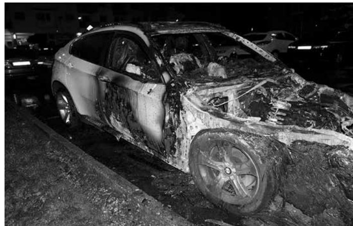
Dňa 14. septembra 2014 horelo v Púchove osobné motorové vozidlo značky BMW X6. Pri požiaru, ktorý má na svedomí neznáma osoba, vznikla škoda 50 000 €.

Najčastejšou príčinou vzniku požiaru bola manipulácia s otvoreným ohňom (46 prípadov, t. j. 32,86 % z celkového počtu požiarov) s priamou škodou 18 280 eur. Následkom úmyselného konania neznámych osôb vzniklo 30 prípadov požiarov, t. j. 21,43 % z celkového počtu požiarov, priama škoda bola vyčíslená na 323 680 eur. Pôsobením elektrického skratu vzniklo 13 prípadov požiarov, t. j. 9,29 % z celkového počtu požiarov, s priamou škodou