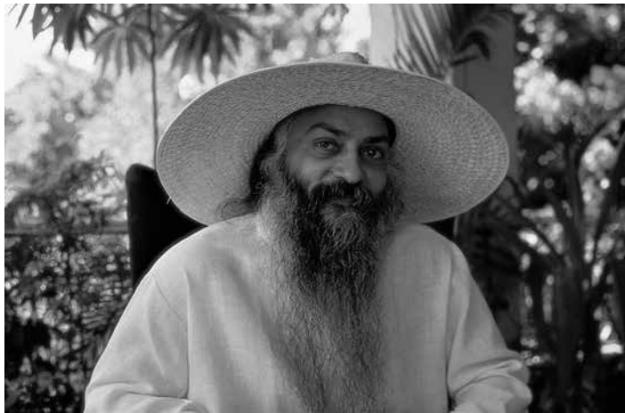
Indický guru Osho (1931 - 1990).