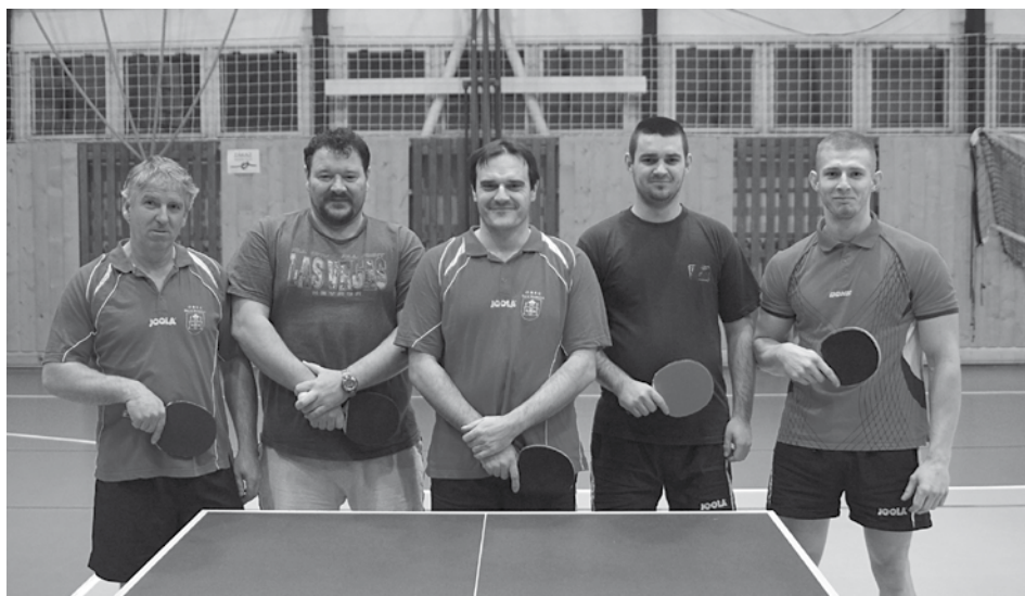
Stolní tenisti Slovana Dolné Kočkovce sú už len krôčik od historického postupu do krajskej súťaže. Zo zostávajúcich troch zápasov im stačí raz vyhrať a raz remizovať...

1.D. Kočkovce 19 15 3 1 217:125 52 2.Dubnica 19 12 5 2 233:109 48 3.N. Dubnica C 19 10 5 4 204:138 44