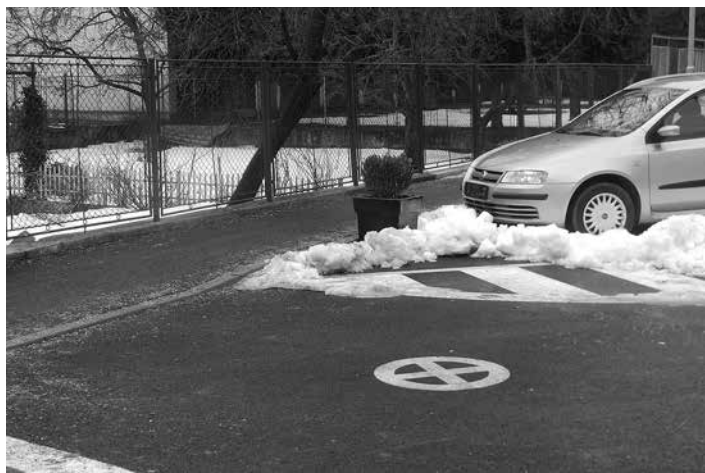
Obyvatelia Požiarinej ulice sa sťažujú, že im parkujúce vozidlá blokujú vjazd z rodinných domov.