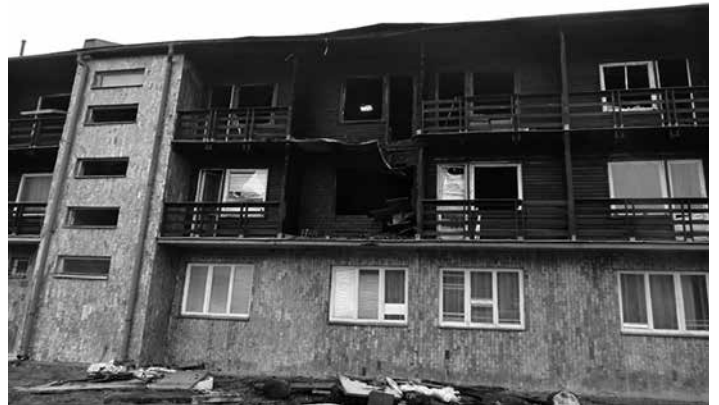
Medzi požiare s vysokou škodou možno zaradiť aj požiar hotela Thermal v Beluškých Slatinách dňa 26. novembra 2014, pri ktorom vznikla škoda 70 000 €. Príčinou vzniku požiaru bolo pravdepodobne úmyselné zapálenie neznámou osobou.