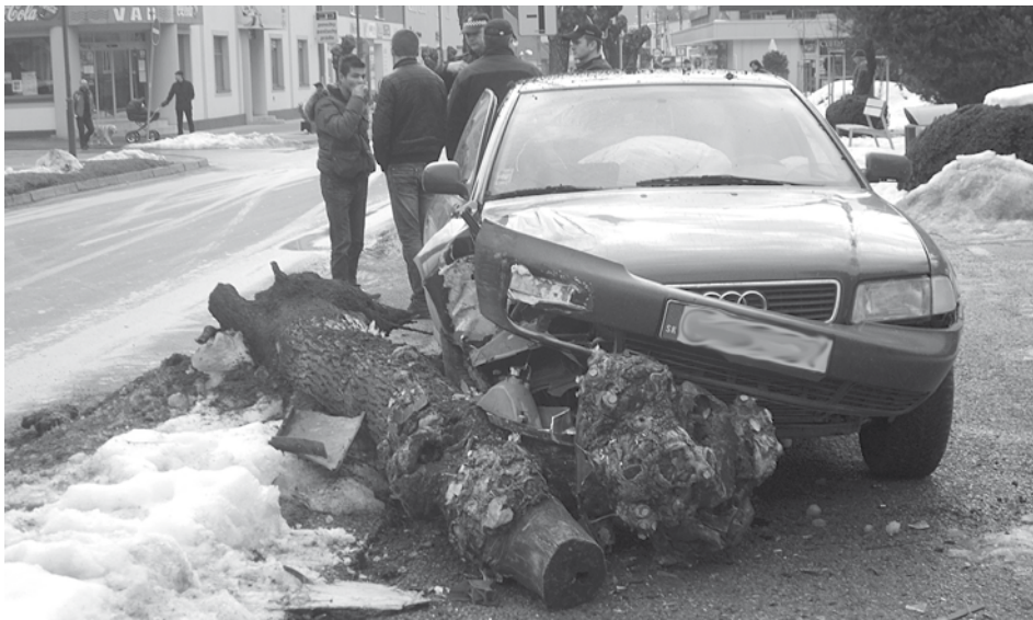
Na „drevorubača“ sa zahral minulý týždeň v Púchove vodič tohto automobilu. Na Štefánikovej ulici zišiel mimo cesty a narazil do stromu.

Na slovenských cestách je tento rok situácia o niečo priaznivejšia, ako vlani. Tento rok sa na Slovensku sa síce stalo o 14 nehôd viac, ako v rovnakom období minulého roku, ale počet obetí klesol o 14. V tomto roku zomrelo na slovenských cestách 34 ľudí, 100 utrpelo ťažké zranenia (medziročný pokles o 60). Najviac obetí má tento rok Prešovský samosprávny kraj, kde od začiatku roka zomrelo pri nehodách šesť ľudí. Najmenej obetí – dve, má Bratislavský samosprávny kraj. KR PZ Trenčín