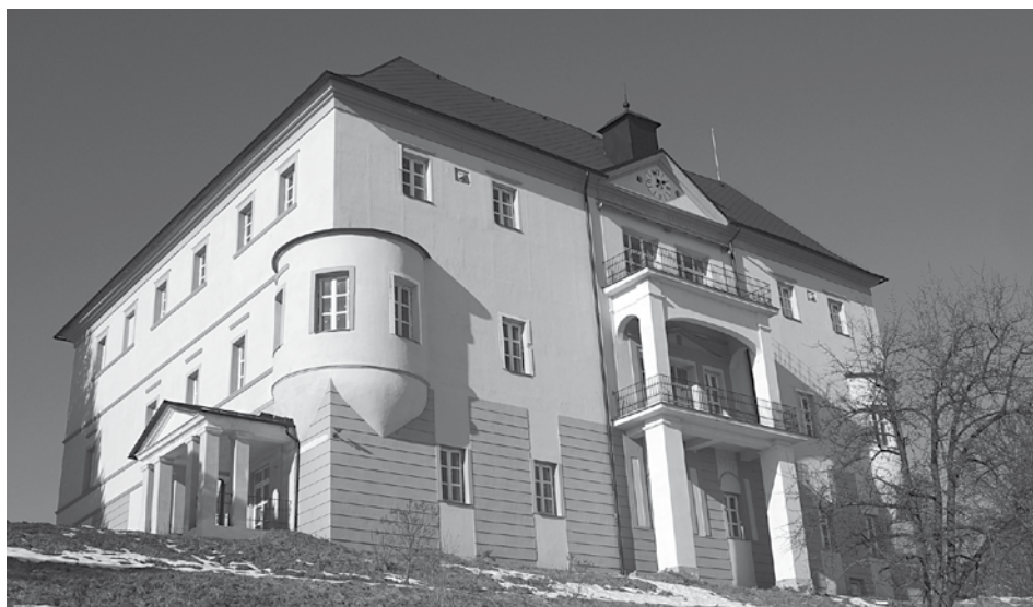
Kaštieľ tvorí dominantu obce Horovce.