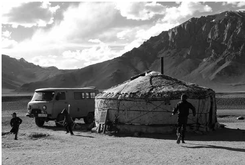
Na návšteve v jurte cestou do Murghabu - Tadžikistan.