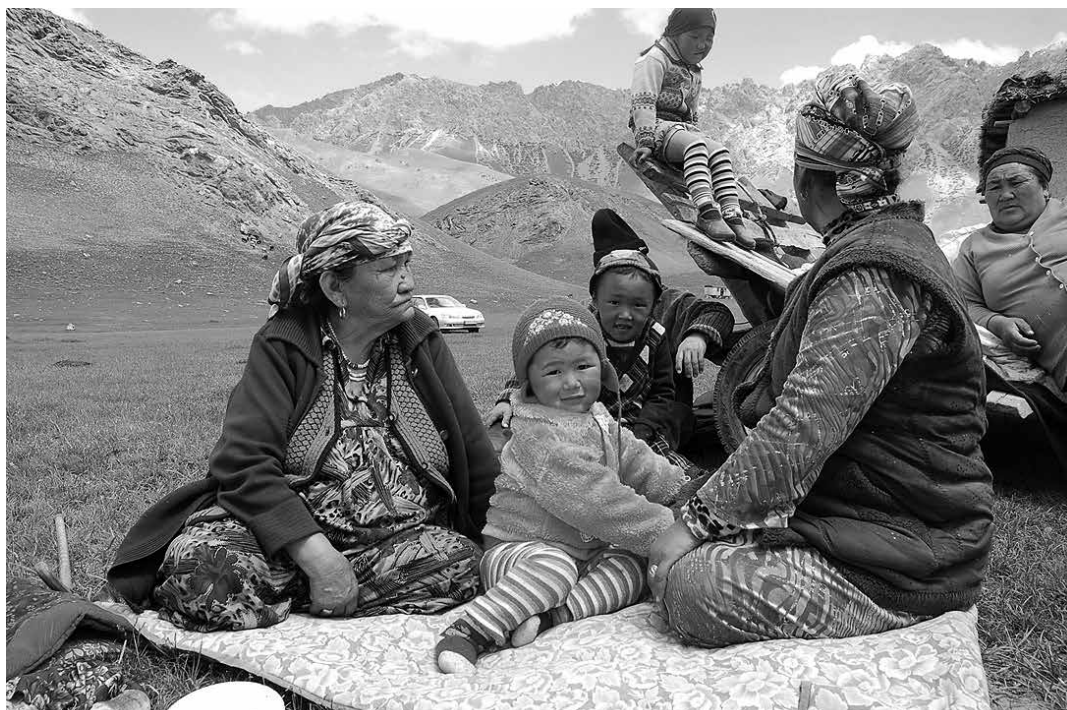
V Alajskom Pamíri - Kirgizsko.