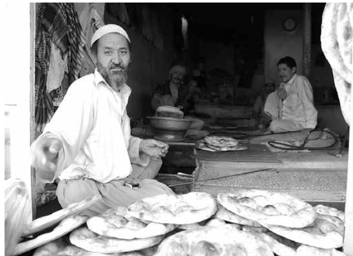
Pekáreň v Kábule.