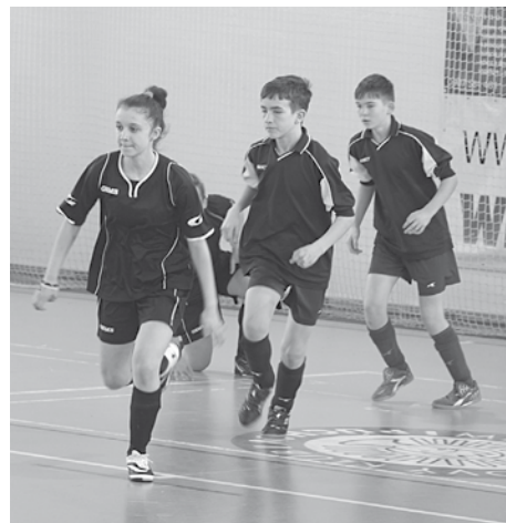
Účast dievčat v žiackych družstvách nie je výnimkou. Niektoré družstvá ich mali hneď niekoľko.