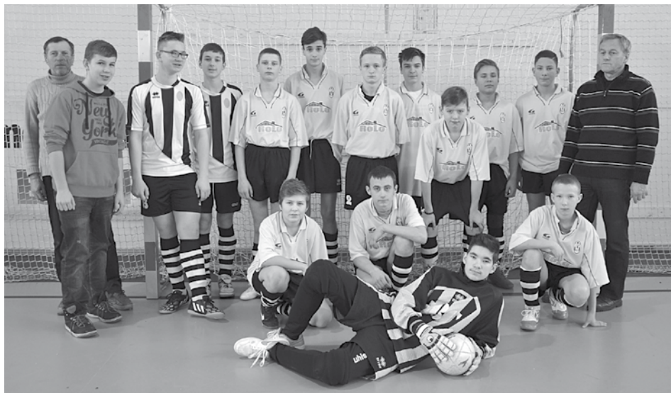
Mladí Streženičania skončili na turnaji v Púchove na tretej priečke.