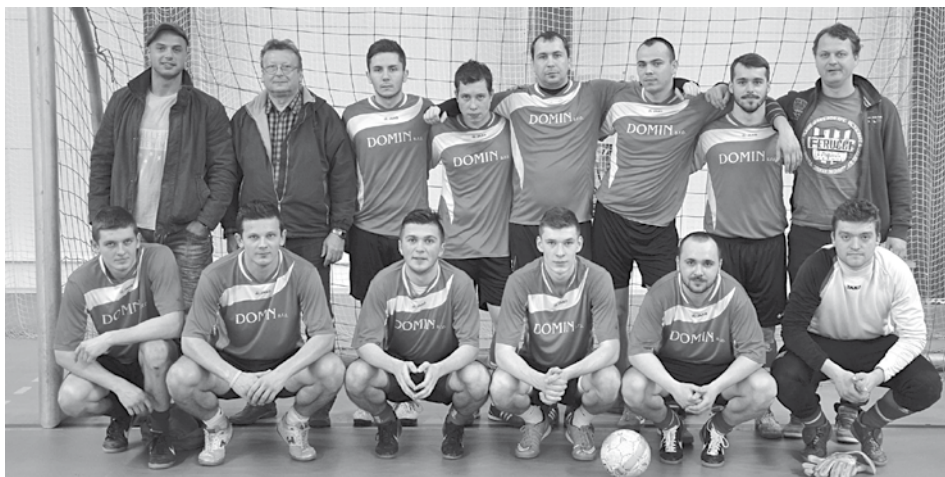
Futbalisti Beluše B obsadili na turnaji O pohár starostu Dolných Kočkoviec druhé miesto za Považskou Bystricou.