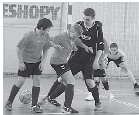
V púchovskej volejbalovej hale sa bojovalo o každú piad' hracej plochy...