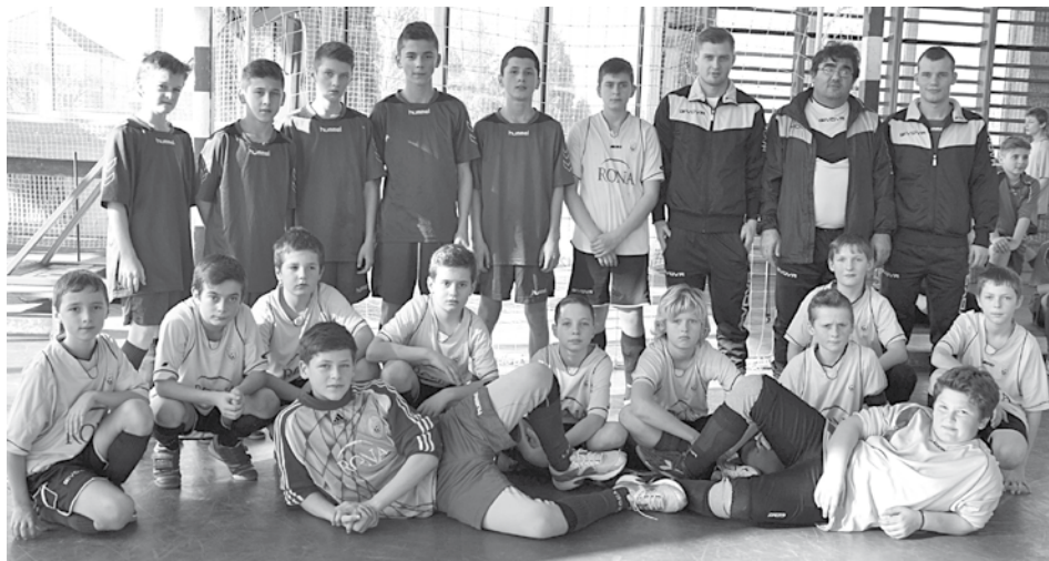
Starší a mladší žiaci Lednických Rovní na turnaji v Novej Dubnici. Viac sa darilo mladším žiakom, ktorí si vybojovali striebro.