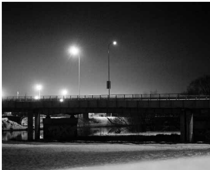
Výpadky osvetlenia na moste, ktorý ústi na odbočku do Horných Kočkovíc a Starých Nosíc, trápia Technické služby už dlhší čas.