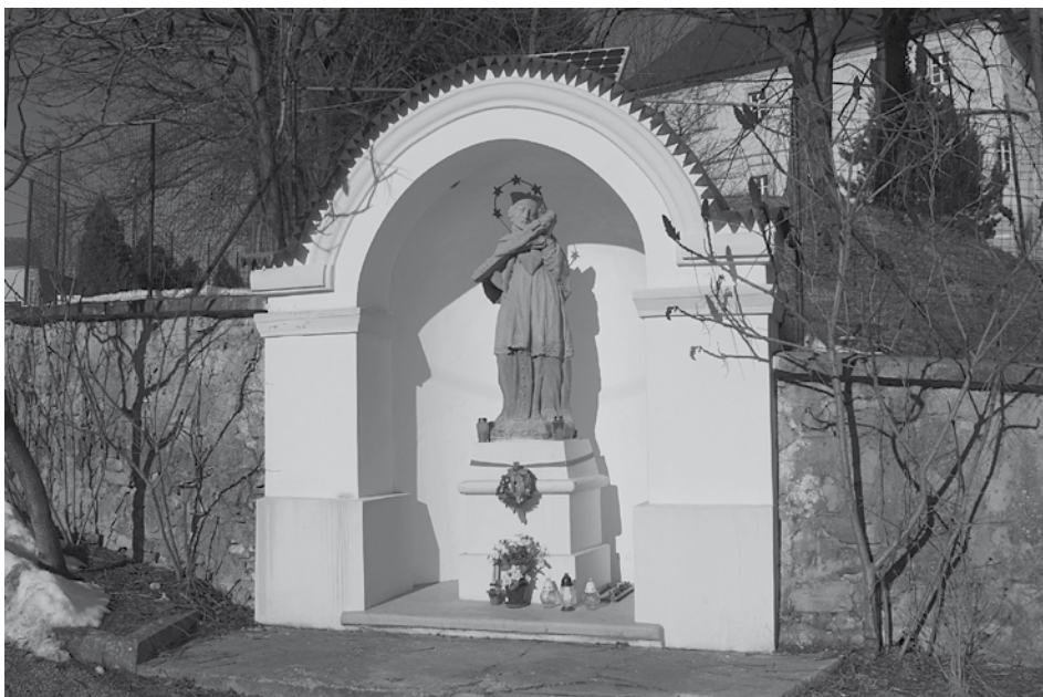
Kaplnka a socha svätého Jána Nepomuckého je súčasťou oporného múru majestátného kaštieľa v Horovciach.

Autor sochy nie je známy, datovaná je do roku 1797, je z pieskovca a vysoká je približne 175 centimetrov. Plastika je v pomerne dobrom stave po nedávnej konzervácii. V prípade celkovej obnovy je potrebné odborné reštaurovanie (v zmysle konzervácie originálu)