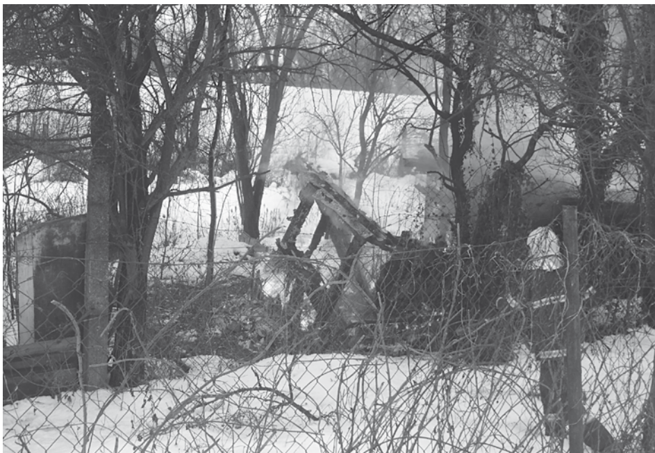
Púchovskí hasiči zasahovali v stredu pri požiari záhradných chatiek v Púchove.

Rovnako dohovaraním vyriešili mestskí policajti prípad šiestich bezdomovcov, ktorí podľa telefonického oznámenia konzumovali na lavičke pred divadlom alkoholické nápoje. Po príchode hliadky už nepili, no vzhľadom k ich podnapitému stavu ich mestskí policajti vyzvali, aby priestor opustili. Výzvu poslúchli.