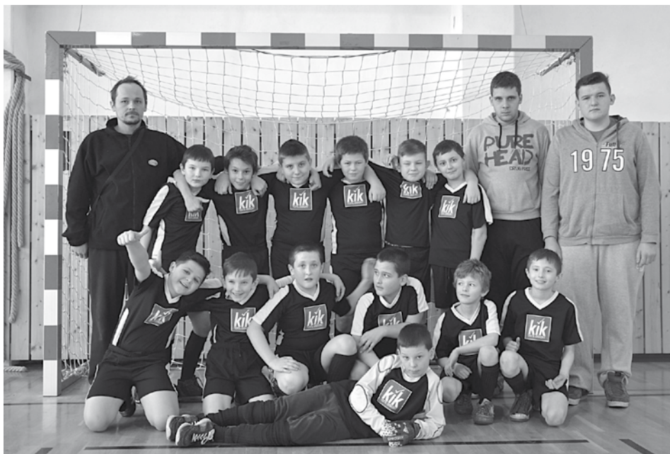
Najmladší futbalisti TJ Hradčan Lednica obsadili na sobotňajšom zimnom halovom turnaji v Bolešove celkove druhé miesto v prvom turnaji. Víťazstvo si odniesli Sverepečania. Druhý turnaj vyhral Dulov, Horovce obsadili druhú priečku.