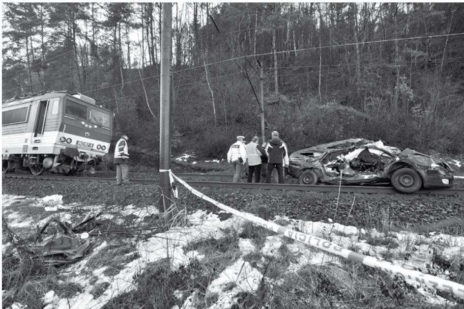
Nehoda na železničnom priecestí v Nosiciach mala pre mladého muža z Beluše tie najtragickejšie následky. Zraneniam podľahol.

Hliadka MsP zasahovala na základe telefonického oznámenia na Komenského ulici, kde osobné motorové vozidlo blokovalo výjazd nákladnému vozidlu. Hliadka prostredníctvom operačné strediska Okresného riaditeľstva Policajného zboru v Považskej Bystrici zistila, že majiteľkou vozidla je žena zo Slavnice, ktorá však bola v Bytči. Po príchode k vozidlu jej hliadka za spáchanie priestupku udelila blokovú pokutu vo výške 20 eur.